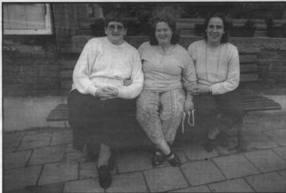
Het andere gezicht van Leuven