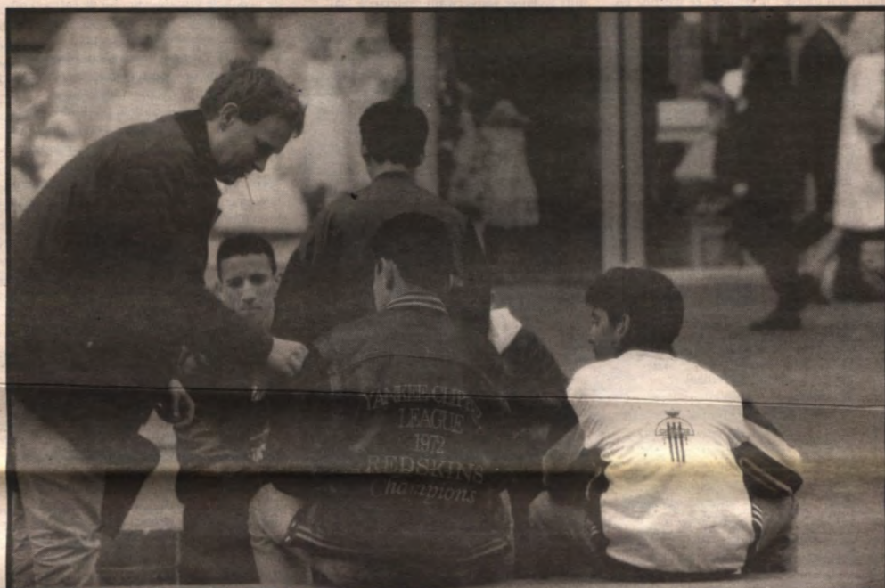
Veto duidt het migrantenbeleid op de middenpagina's.

Meerkwaardig is dat de meerderheid van de eigenaars geen reden geven voor hun beslissing. Als er na een vraag om bij-