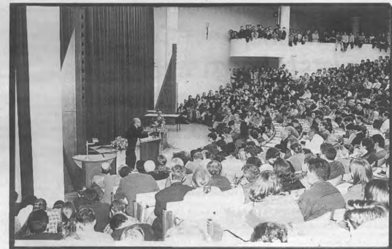
Tijd voor aula's van de 21e eeuw.

Enkele dingen uit Eyskens' les zijn de moeite waard om te onthouden. Uit