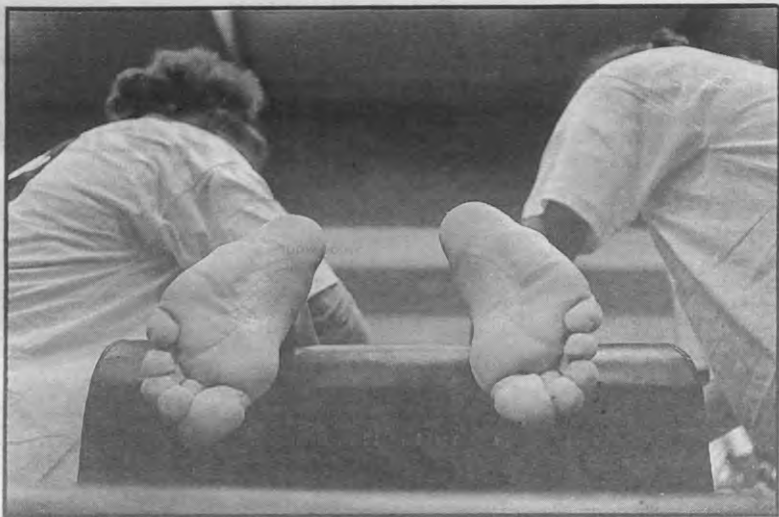
En dan de massage, je zou voor minder de benen uit je lijf lopen.