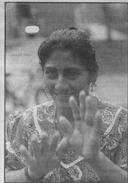
Zeventig procent van de Guatemalteken.

Ross: «Ik ben ontvangen op het Belgische Ministerie van Buitenlandse Zaken. De vertegenwoordiger waar ik mee sprak, zat er volledig naast. Hij wees me op een landkaart van Centraal-Amerika alle 'jonge democratieën' aan, waaronder Guatemala. Verder reikte zijn informatie niet. Ik heb hem erop gewezen dat hij zeer slecht geïnformeerd was: de reële situatie in Centraal-Amerika is niet zo rooskleurig. In Guatemala heeft nooit een jonge democratie bestaan. Democratie houdt immers in dat de gehele bevolking vertegenwoordigd is. Binnen de regeringen worden kleine aanpassingen uitgevoerd. Afen toe wordt een dunne minister vervangen door een dikke, maar hun ideeën zijn de-