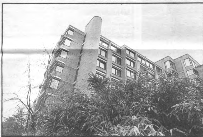
Moeten we daar nog 20 jaar tegen aankijken?