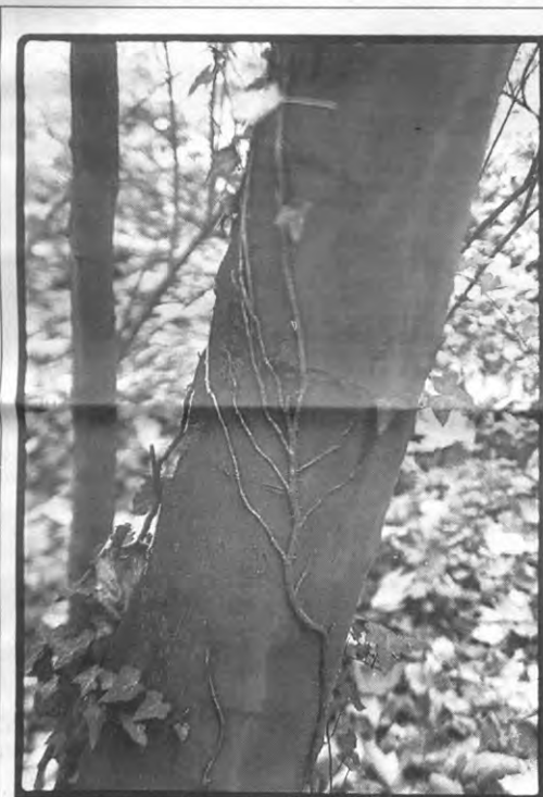
Als uw aders er zo uit zien als die op de foto, is het hoog tijd voor een aderlating.

In het kader van de Student Aid-actie van dit jaar, zal VTM de prijzenpot van een van de afleveringen van Waagstuk een goede bestemming geven. Wil je in die uitzending zitten, stel je dan kandidaat voor 16 november op het nummer 03/220.44.75 (werkdagen van 14.00 tot 18.00 uur), of contacteer Student Aid Leuven, Sint-Michielsstraat 6, 28.45.81 (werkdagen van 18.00 tot 20.00 uur). Presetie op 22 november om 13.00 uur in de Grote Aula van het Maria-Theresiakollege.