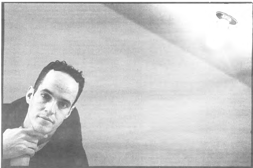
“Mijn identiteit heeft meer te maken met klasse dan met seksualiteit”