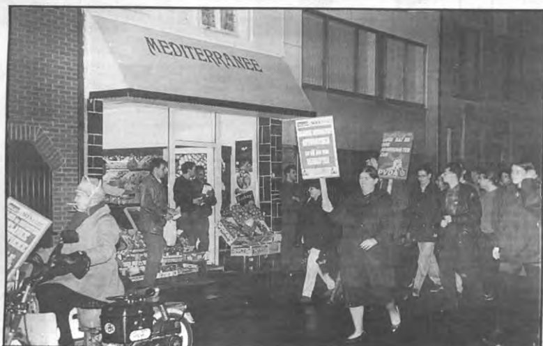
Goed dat er nog nachtwinkels zijn.

Redaktievergadering iederde vrijdagmiddag om 15.00u