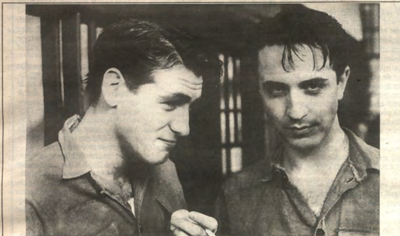
Deze week brengt 't Stuc twee films en een vijftal videofilms met als thema homoseksualiteit. Uiteraard is Tom Kalin van de partij, maar er zijn er meer. Een tipje van de sluier op pagina zeven.