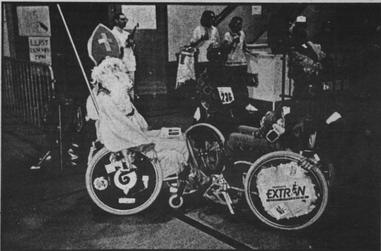
Oude man, snelle stoel