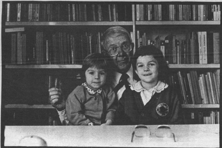
Transformationeel gegenereerde kleinkinderen.