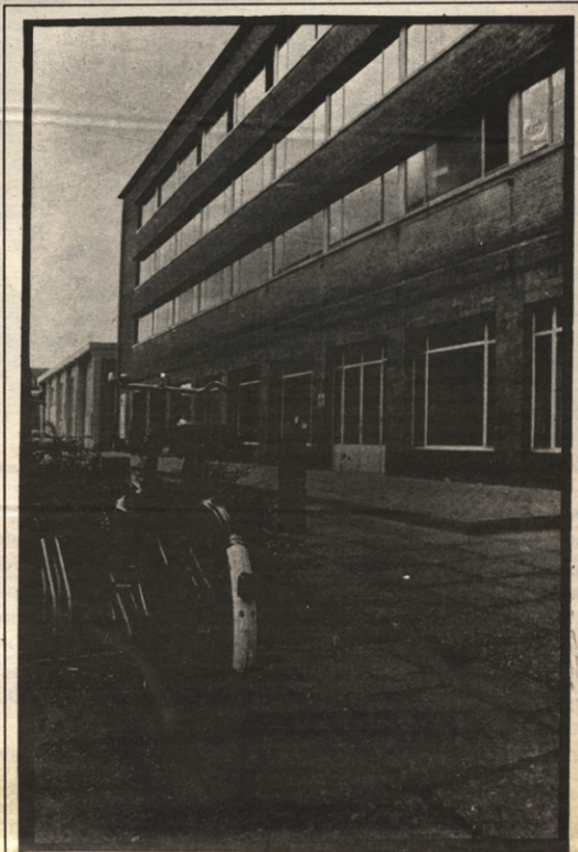
Wort het Stuc binnenkort De Singel van Leuven? Een netelige vraag waarover Loko zich misschien ooit (binnenkort?) mag buigen... Het wordt spannende tijden.