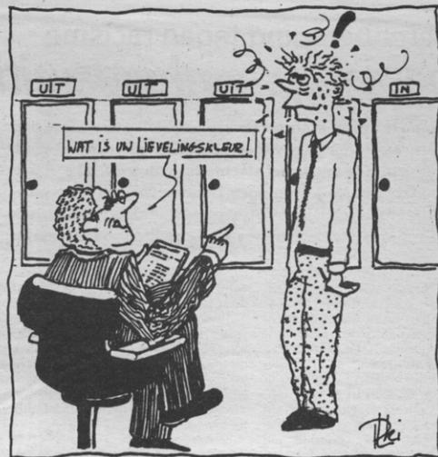
Selektiekriteria numerus clausus fel overtrokken

De CVP bracht in juni met haar uitgewerkte nota rond numerus clausus wel enig soelaas en reageerde zowel op het voorstel Valkeniers als op het SP-standpunt. Het standpunt is een duidelijk njet aan numerus clausus en de argumentatie is zeer grondig uitgewerkt. Wel blijft er nog een achterpoortje open staan: de CVP pleit voor een behoevenstudie in de gezondheidszorg. Ze gaan er wel van uit dat op dit moment en in de toekomst de behoefte naar gezondheidszorg toeneemt in plaats van afneemt. De vraag is dan in hoeverre ze op hun principiële standpunt zouden blijven staan in het geval de behoevenstudie het tegengestelde zou beweren. Toch laten ze niet veel kansen open voor een numerus clausus en grijpen ze te rug naar het tien-punten-plan van Daniël Coens.