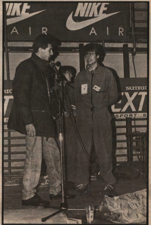
De man die regen en wind trotseerde en net als vorig jaar de maraton won.

Als ze maar aan hun eigen instelling blijven