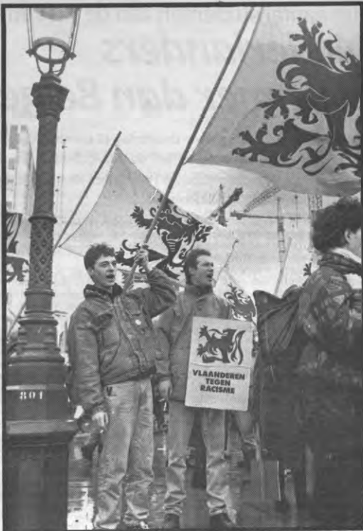
Hoewel er enige verwarring ontstond met de meer gebruikte term 'bewustzijnsverruiming', kozen een aantal VUjo'ers toch voor de aktie van Verhofstadt.

Wel nog een probleem vormt het standpunt rond de migranten. "Er wordt daarbij teveel nadruk gelegd op de negatieve aspecten van de mi-