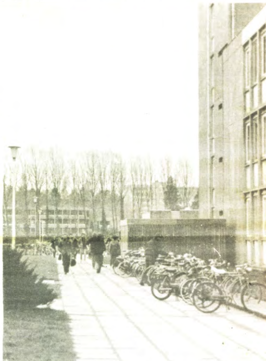
HEVERLEE - De terreinen van TW '88 maken zich op voor de viering van de 125ste editie. Maar ze houden het 'burgerlijk'.