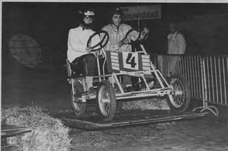
Hoe sterk zijn de eenzame kwistaxers die kromgebogen over hun stuur naar de flosj grijpen?