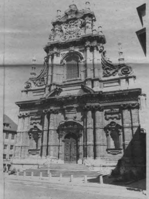
De grote slagroomberg wordt pleisterplaats voor alben en biechtstoelen. Kwestie van weer volk op bezoek te krijgen.