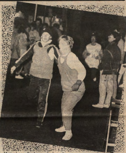
24-urenloop: dinsdagavond ploeterden een massa toeschouwers door de modder rond de piste. De opkomst van de lopers was daarentegen allesbehalve massaal. Vorige week berichten wij reeds over de rekordopging van Apollon, Ekonomika en VTK. De laatste twee haakten echter af(?); het rekord van Apollon is dus sowieso een feit. Volgende week een uitgebreide reportage hierover in Veto.