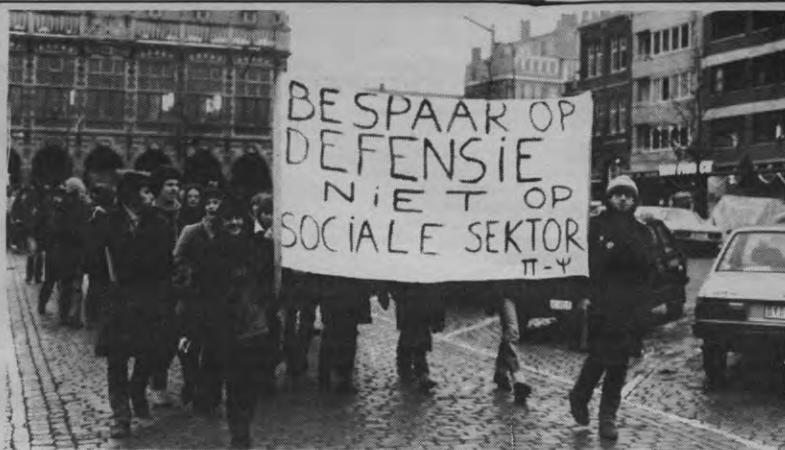
De Alma-akte twee jaar geleden: een vreedzame groep van studenten psychologie en pedagogie komt op voor een voedzame besparingsformule

In deze discussie heeft SORA de laatste tijd geen duidelijk standpunt ingenomen. Een positiebepaling dringt zich wel stilaan op. De standpunten uit het verleden leken allzins eerder te gaan in de richting van "Er is nog geld dat kan aangesproken worden, o.m. door demokratisering van het onderwijs." Bovendien werd de hoofdverant-