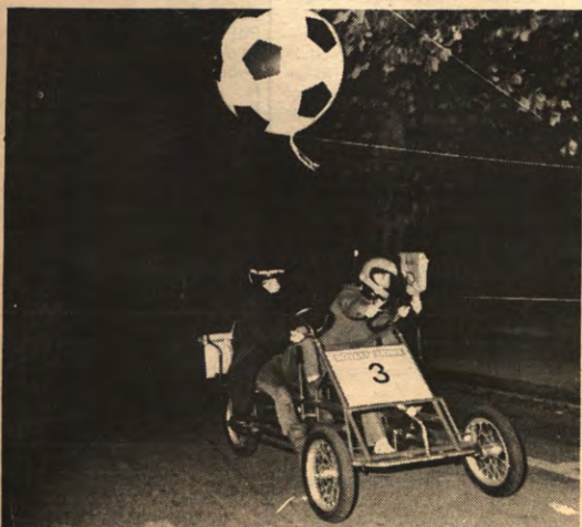
Achter de pits: er komt bij de kwistax-race heel wat meer kijken dan de dingen die je op de piste ziet. Een kijkje achter de wip en de chicane.

Na vijftig meter wedstrijd loopt het al mis. De speciale driezitter, die bedoeld was voor de tijdritten om de startposities te bepalen, zakt na een halve ronde door zijn as. De tijdritten worden dan maar met een gewone tweezitter gereden.