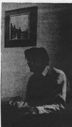
Cage: altijd gewild, nooit gekregen: de opname van Stockhausens ‘Kreuzspiel’.

Na zijn studies in Parijs-bij Messiaen en Milhaud-schrijft Goeyvaerts rond 1950 de ‘Sonate voor twee piano’s’, gebaseerd op de parameter-idee. In 1951 bezoekt hij een kompositiesemi-