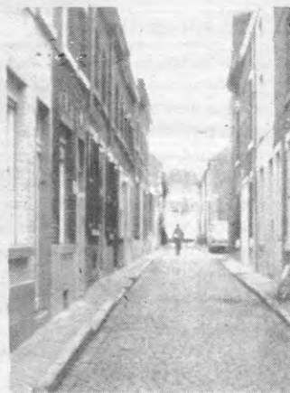
Huurwet: voor de huurder een straatje zonder einde.

ze voor de keuze te stellen: deze huurwet, of helemaal geen huurwet voor 1984. In andere woorden: bijna geen rechten, of helemaal geen rechten voor de huurder. De huurdersbeweging en de oppositiepartijen eisen daarentegen dat de tijdelijke huurwetten noch verlengd worden, met een maximale huurprijsstijging van 3% in 1984. Op die manier komt dan tijd vrij om alle voorstellen van huurwet grondig te bespreken.