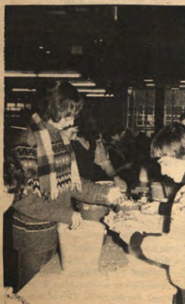
Alma-bezetting januari 1982: studenten verkopten in zelfbeheer maaltijden in Alma 2 uit protest tegen de prijs- verhoging.

J e zal het niet elke keer besef- fen als je in de Alma, Sedes, Gasthuisberg of het Meis- jescentrum een hamburger of een biefstuk gaat eten: die maal- tijden worden gemiddeld voor een derde gesubsidieerd. En dat is maar goed ook, vindt Sociale Raad. Want tenslotte zijn de Alma's en aanverwanten een onderdeel van de sociale sektor van de universiteit. Die moet er toe bijdragen dat de financiële last van het studeren aan de unief (en daarvoor moet je ook eten...) zo laag mogelijk wordt gehou- den. Vandaar de subsidies, ook voor de Alma. De laatste pak- weg tien jaar echter komt die sociale funktie van de sociale sektoren meer en meer op de helling te staan. En daar is het ons in dit artikel precies om te doen.