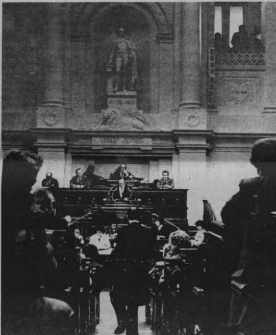
Marathonzitting van ASR's Stuurgroep: de begroting wordt verdeeld voor de Raad van Studentenvoorzieningen.

Het telefoongebruik (geschat op 244000 fr.) in 't Stuc en de aankoop van reeds vermeld kantoor materiaal en poetsmateriaal (59000 fr) zijn de hoofdverant-