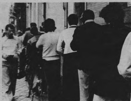
Studielast kan zwaar lijken. Gelukkig volgt er een lange en welverdiende rust aan het doplokaal.

Programmahervormingen gebeuren maar al te vaak in het wilde weg. Men geeft zich zelden of nooit rekenschap van een eventuele toename van de studielast. Denk maar aan de voorgestelde programma-hervorming in wiskunde/informatika (cfr. VETO nr. 6) en aan de willekeurige toevoeging van maar liefst 3 semester-uren in eerste kan filosofie dit jaar. Men beschikt niet over nauwkeurige metingen van de belasting van oude of geplande vakken.