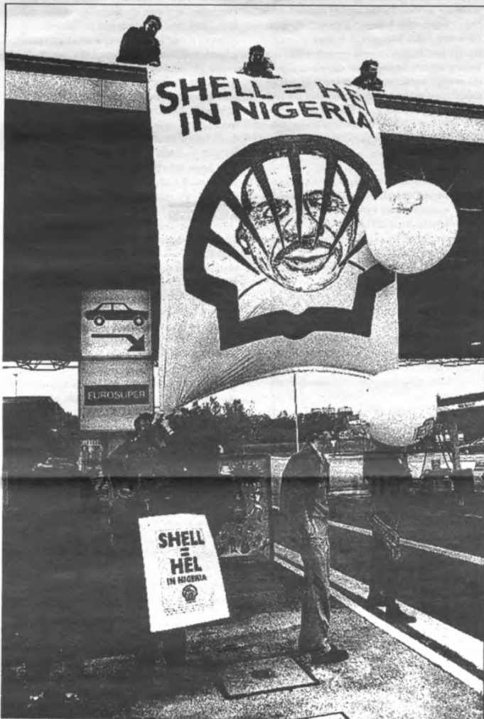
Running shoes by Nike? I'd rather take my bike