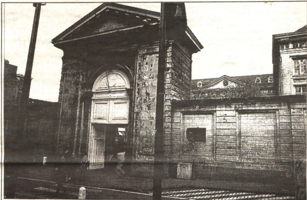
Over deze fakulteit en haar activiteiten kan u meer lezen in de lezersbrieven op p. 2 (met het woordje van de preses), op p. 5 (rechtsonderwijs) en p. 6 (Election Night)