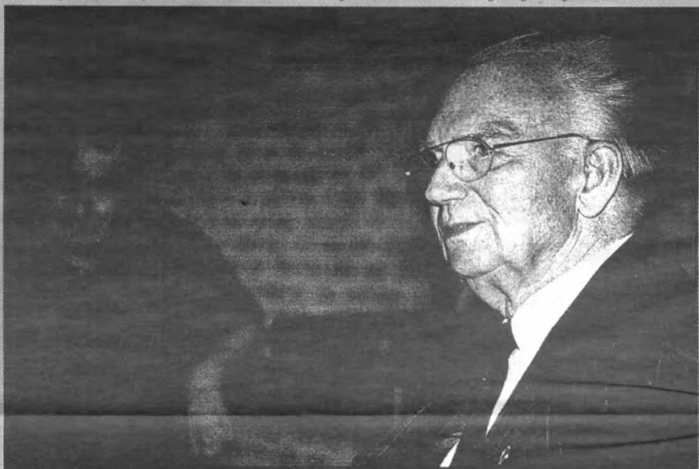
"Van een student verwacht ik dat hij studeert, en niets meer"

verlies voor de wetenschap! Toen ik begon te doceren, moest men enkel examens afnemen, voor de rest niets. Doceren deed je natuurlijk ook, maar al dat vergaderen van nu was er toen niet bij. Iemand als Röntgen bijvoorbeeld kon zich dan volledig toelagen op zijn vak. Hij bleef gewoon thuis zoeken en experimenteren en zo heeft hij de Röntgenstralen uitgevonden. Je kan toch niet ontkennen dat dat enig nut heeft gehad, hé? Zulke dingen kunnen nu niet