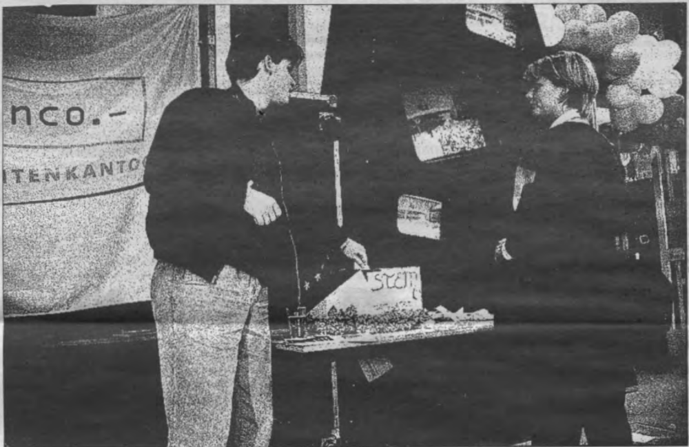
Three votes for Mr. Dole from the Silly Party