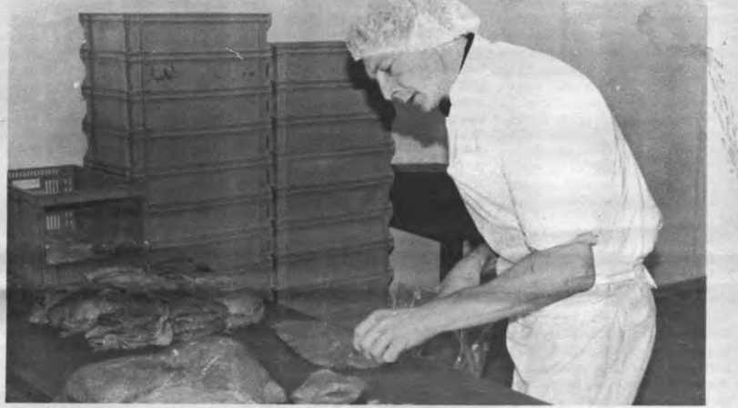
Zeg nooit kok tegen een chirurg.