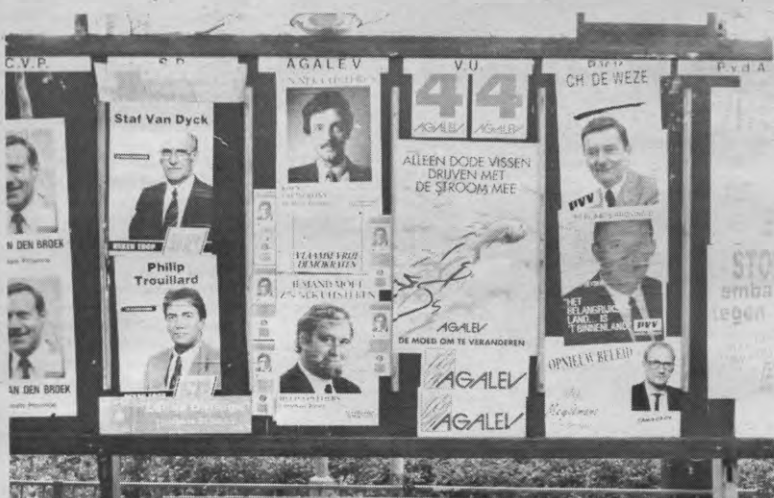
Coveliërs bij Agalev en vissen bij de VU, hum.