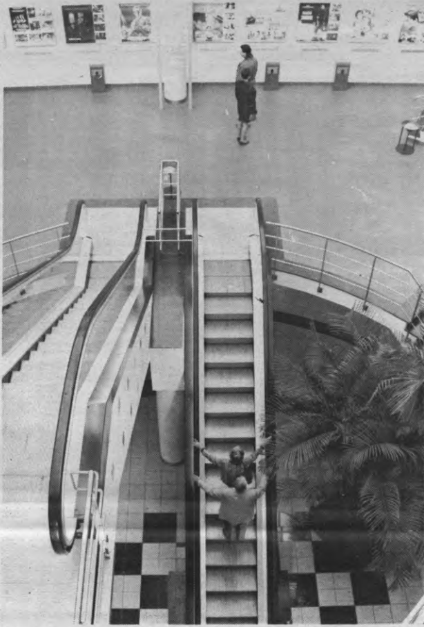
Ze zijn oerverveld, en als je er één gezien hebt, heb je ze allemaal gezien. Wij hebben er in Leuven de laatste jaren geen een gezien. Ook oerverveld.

Omdat de films vertoond werden zonder synkron geluid, zorgde een orkest veelal voor de begeleiding. Het filmprogramma nam bijna drie uur in beslag: korte filmpjes van 20 minuten werden afgewisseld door een pauze die opgevuld werd met piano- of orkestmuziek. Tot 1918 waren de Leuvense bioskopen de enige ontspanningscentra. Waar aanvankelijk alleen de burgerij kon kennismaken met het medium film, was de bioskoop rond 1914 al definitief ingeburgerd bij de grote massa, die zo goedkoop nieuwe kennis, ideeën en inzichten kon verwerven.