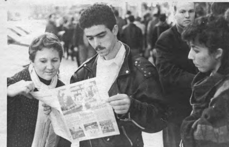
"Hee, dit gaat ook over mij!"

De Volksunie is vooral bang dat het ondertekenen van dit manifest de "polarisering rond dit thema in de hand zou werken", alhoewel ze wel beweren zich aan de "letter en de geest" van de verklaring te zullen houden. De PVV zegt het niet nodig te vinden om dit initiatief te ondertekenen omdat ze, alhoewel niet van plan om een racistische campagne te voeren, het thema toch niet uit de weg wilt gaan. Het Vlaams Blok tenslotte vindt dat ze "vanzelfsprekend aan de oproep geen gevolg kan geven".