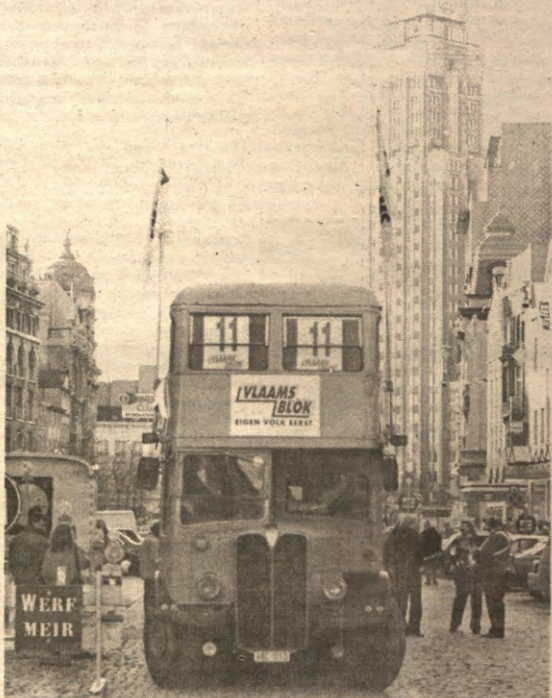
Op 24 november is het zover. Dan trekken we allemaal naar onze dorpsgemeenschap om te stemmen. In afwachting kan je alvast enig denkwerk verrichten en je bezinnen na het lezen van de verkiezingskatern. Pagina's vijf tot en met acht.