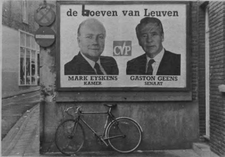
Als ze maar onze fietsen laten staan.