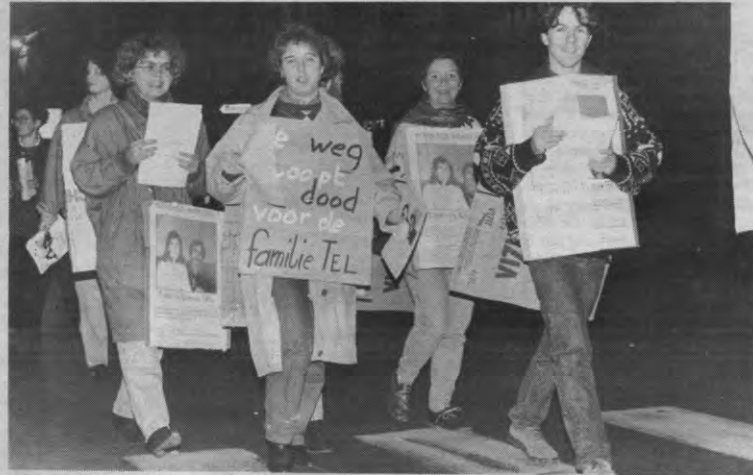
Afgelopen dinsdag werd na zevenen betoogd voor de familie Tel. Omdat niet alle Turken buiten moeten.