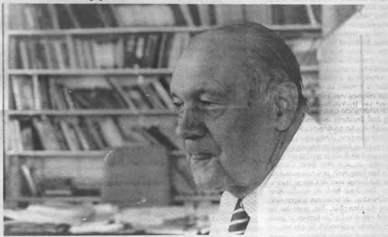
“Studenten lenen zich makkelijk tot medische proeven, natuurlijk mede uit economische overwegingen, en niet uitsluitend om de wetenschap te dienen.”