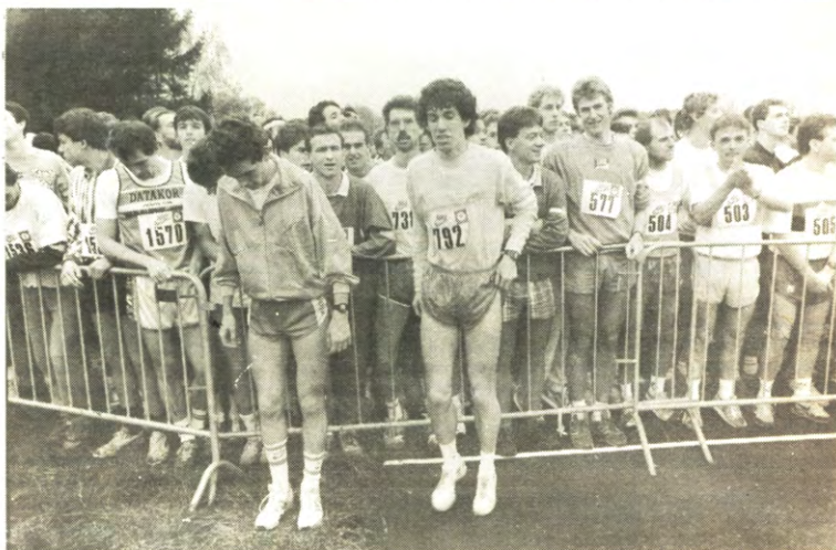
Troesjes studenten verzamelen zich voor de studentenmaraton. Een sportief sukses, maar organisatorisch geen hoogvlieger. Moest er nog water zijn?

Op dat moment zijn de eerste maratonlopers al een tiental minuten, onder luide aanmoedigingen, gepasseerd. Langs de rechteroever weliswaar, want het jaagpad is veel te smal om doorgang te verlenen met de grote groep lopers van Mechelen in startpositie. De eerste 'Antwerpenaars' - om 14.30 u vertrok-