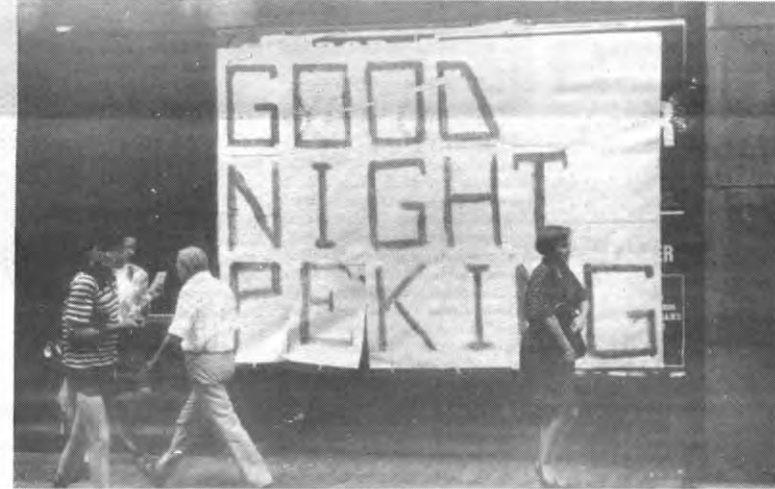
Vrij naar Mao: de nacht komt uit de loop van een geweer.