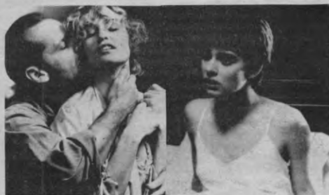
Over femmes fatales gesproken: Jessica Lange (links), zelfs met Jack Cuckoo N. om de nek, moet het als Cora in THE POSTMAN... afleggen tegen Lana Turner — beaten by one tit . Maar dan is Nastassia Kinski (rechts) in CAT PEOPLE toch surely the nipple of it all.