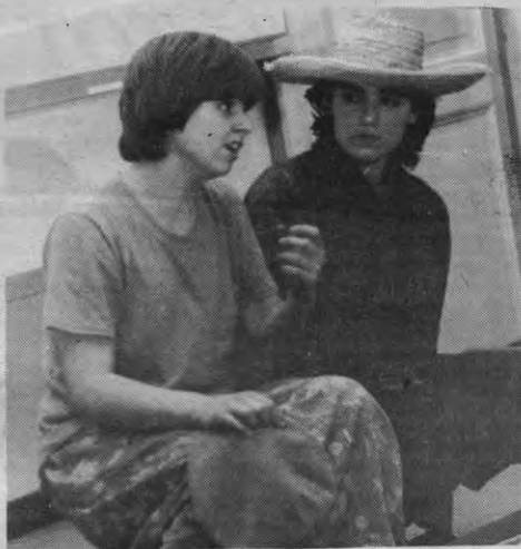
Dromen over een nieuwe solidariteit (foto: toneel), zonder een new society, op een sterk versplinterde eilandengroep.