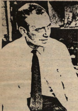
Nobelprijswinnaar James Watson tijdens zijn kleuterjaren, toen hij het dubbel-helix model voor DNA voorstelde.