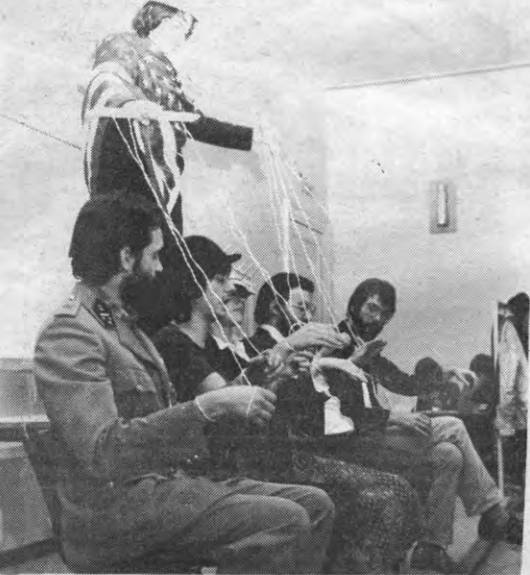
De diktatuur van Marcos & echtgenote, de lakei-generaal en de Amerikaanse dollar-rechter: de USA heeft de touwtjes in handen