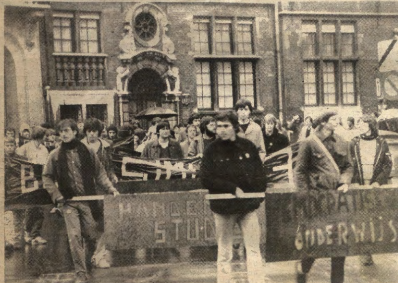
November is daar en de studenten komen op straat. Enigszins gedecimeerd in aantal en zonder veel overtuiging, maar het regende dan ook. (Betoging 9 november '82)