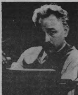
Dashiell Hammett zit achter de tikmachine met de revolver in de aanslag; of: hoe realiteit en fictie tot een bizarre derde, narratieve dimensie versmelten. Frederic Forrest creëert een stevige hoofrol in Wim Wenders' "film noir"-persiflage Hammett (1982)

(1981, zie bespreking van wijlen Marcel den Boer in Veto, jg. 8, nr. XVII, p. 5), die vanwege zijn accumulatie ad absurdum van "film noir"-ingrediënten (o.a. de Driehoeken, de levensmoetheid, ...) de eerste halfkomiek is in het genre. Hoewel het verschil tussen Coup de Torchon en b.v. Hustons Maltese Falcon (1941) al enorm is, kan men nog een stap verder gaan en als "film noir" nieuwe films typeren die een eigenlijk ongewilde, haast onvermijdelijke, gedeeltelijke band vertonen met de oude RKO-voorloper. Waar de hedendaagse filmer zich met de psychische realiteit-van-nu bezighoudt, blijkt hoezeer de forties en de eighties tweelingen zijn. Voor de filmkritiek houdt dat in dat de term "film noir" via zijn verhoogd gebruik zijn eigenlijke kwaliteitsconnotatie gaat verliezen en niet meer een reeks films, maar eerder een basisthematiek in dé film gaat definiëren. Zo ligt het voor de hand Chinatown (1974) en Taxi Driver (1976) als "film noir" te systematiseren. Maar misschien heeft zelfs Fassbinder er dan een gemaakt? Dat zouden wij dan wel zwart inzien.