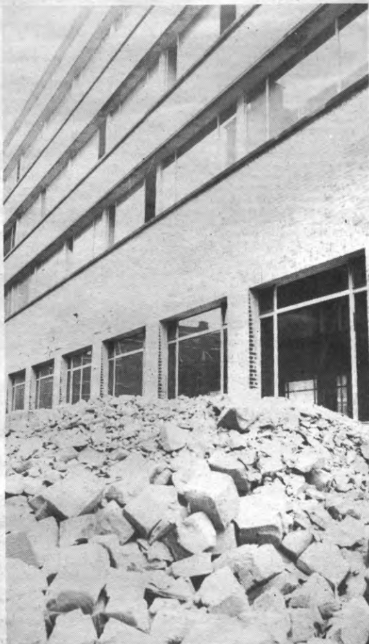
Verbouwingswerken aan de 'Cercle' in augustus 1977 die leidden tot de opening van 't Stuc op 19 oktober '77.

mentenbestand daarna stabiliseren rond 5 à 600 omwille van de als te radicaal ervaren toon der artikelen. De redactie bleef lange tijd bestaan uit een tiental leden, samengesteld uit studenten uit de raden, enkele vrijgestelden en enkele geïnteresseerde studenten. Kultuurraad bleef in Veto een kalenderaffiche verzorgen. Toen haar activiteiten uitbreiding namen, publiceerde Kultuurraad vanaf 1978 de eigen 'Stuc voor Stuc' die binnen het Veto-abonnement was geïntegreerd. Dat was ook het geval met 'Sportunieffe' in dat jaar, dat maandelijks in bijlage bij 'Veto' werd uitgegeven omdat Sportraad te weinig ruimte had binnen de 'Veto'-bladzijden om verslag te doen van haar activiteiten en van de competitie-uitslagen. Na een jaar verdween 'Sportunieffe'.