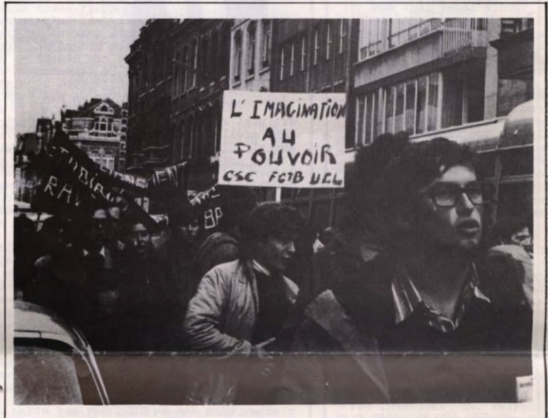
Enkele van de 12.000 betogers op de Nationale Betoging te Brussel op 21 november