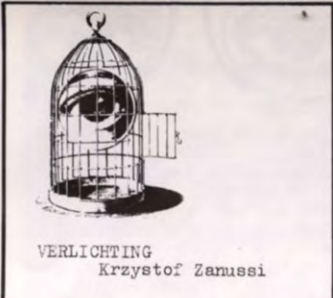
VERLICHTING Krzystof Zanussi

Pas via een persoonlijk door - leeftse ervaring ook, en gerugg esteund door een levensvisie, kan men een antwoord vinden op levensproblemen, en de werke lijkheid in haar kern vatten: de mens kan steeds uit het slijk ijk waarin hij, soms letterlijk voortploetert, opstaan, en zijn eigen waardigheid bevestigen en herwinnen.