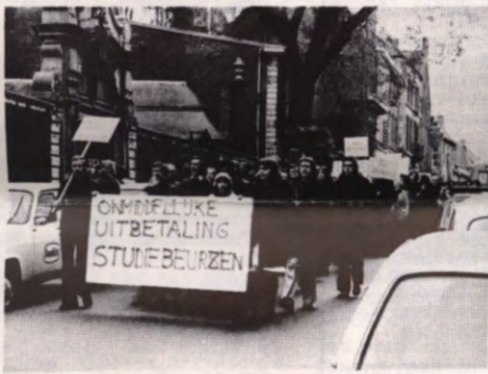
De regionale betoging te Leuven op 13 november: personeel en studenten in één front.