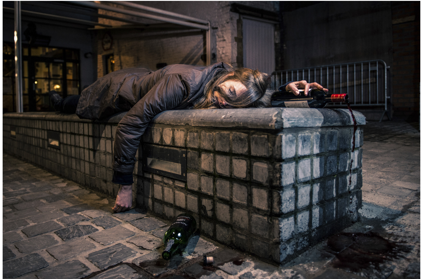
Alcohol is de enige drug die legaal is. Volgens experts moeten mensen meer gewezen worden op de gevaren van alcohol. Mensen getuigen over hoe alcohol hun leven verwoestte. Dossier op pagina 8 en 9