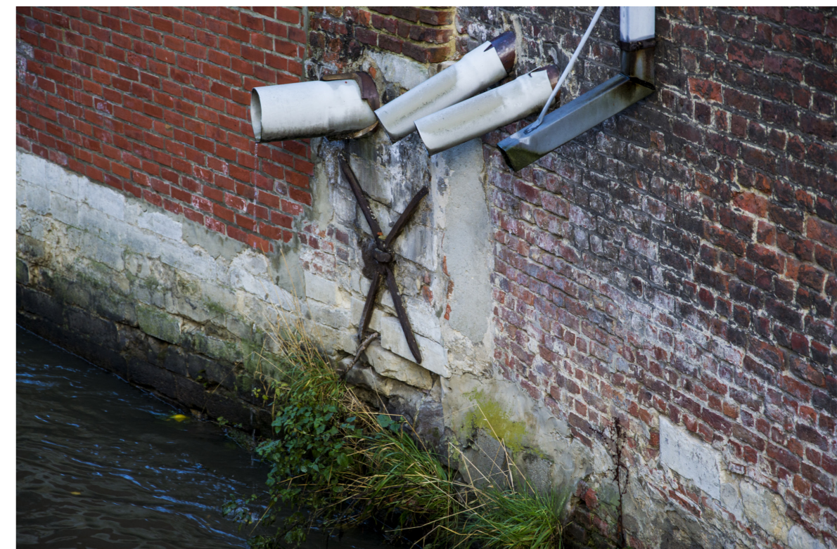
De riolen druppelen in de Dijle

De serieuze studie waarnaar van Lierop vraagt zal in de komende jaren een evenwicht tussen het historisch-culturele aspect, het ecologische aspect en de noden van de bewoners moeten vinden. Ten laatste tegen 2019 hoopt van Lierop dat er met de aansluiting van het Zwartzustersklooster geen druppel afvalwater van de universiteit in de Dijle vloeit. Dat wordt dus nog even afwachten.