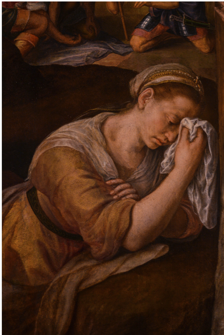
Kalina De Blauwe

het gigantische wandtapijt in zaal 23. Daar kan men onmogelijk naast kijken. Wie eerder al het hoofd licht voelde worden van moordlust na de onthoofding van Goliath kan zijn hart ophalen bij het ragfijne en monsterlijk grote