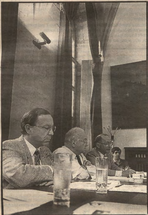
Stad & KU! broederlijk aan tafel