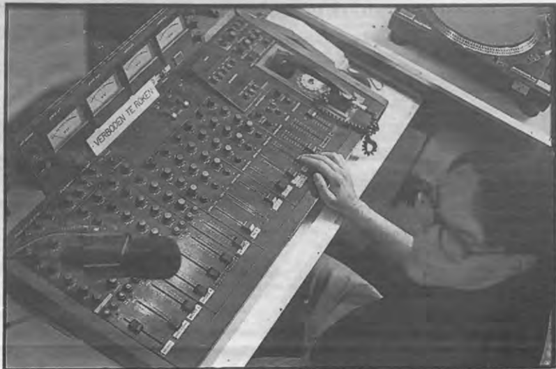
Eén van de nadelen van het vrijwilligersstelsel