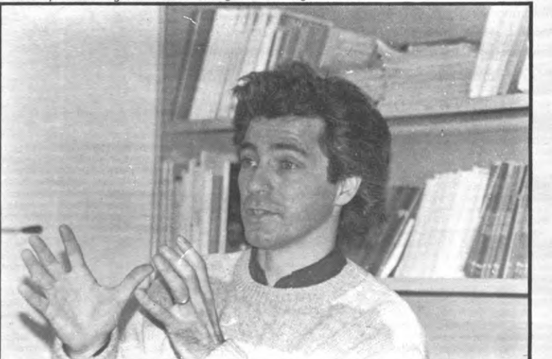
Ook in de verenigde staten is er een kloof tussen burger en politiek