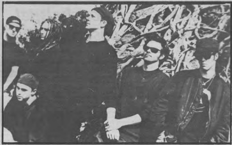
Neurosis' werk kenmerkt zich inderdaad door een mengeling van psychedelisch en een donkere dreigende aan new wave herinnerende sfeer.