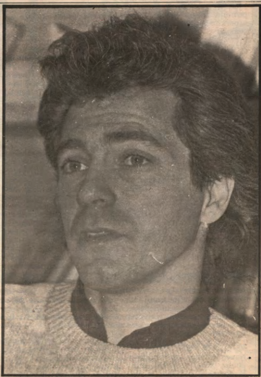
Deze week is het volop verkiezingsweek, bij het VRG doen ze 't een en 't ander, maar dat wist u ongetwijfeld al. Wij gingen avast politkoloog Brooks interviewen, een specialist ter zake.