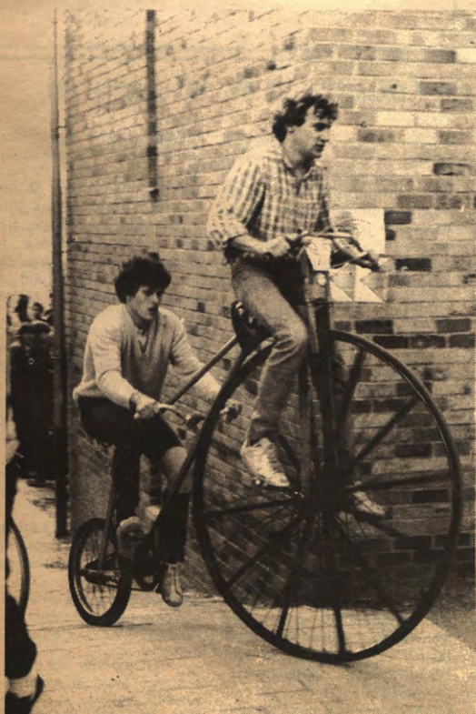
Naast de 'echte' competitie zijn er een heleboel ploegen die hun deelname iets ludieker opvatten. De gekste konstrukties kon je in Louvain-la-Neuve zien bollen; de enige beperking was er de fantasie en misschien ook wel de zwaartekracht.