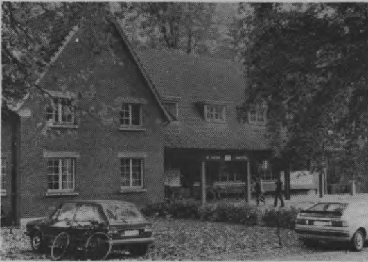
In Louvain-la-Neuve zijn alle Alma's reeds geprivatiseerd. Is het 'geval De Kantien' een teken aan de wand voor de KUL?

licht de twee dames die tot nu toe de kafeteria openhielden. Verscheidene voorstellen zijn gedaan en uiteindelijk heeft ALMA deze mensen zelf laten kiezen. MANGELSCHOTS: "Ik heb gezegd, kijk, ge krijgt de keuze, ofwel zorgen wij voor een vervangende oplossing, ofwel gaat ge vrijwillig naar die mensen (VVC, nvdr.) maar dan heb ik liefst dat ge een definitieve keuze maakt". Een voorstel van de VVC om die mensen op de personeelslijst van de ALMA te houden en 'uit te lenen' aan hen werd niet aanvaard door de