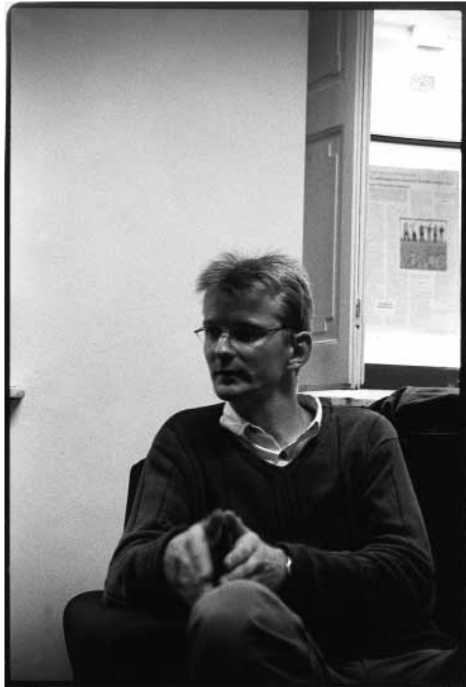
“Eureka, ik heb de Chrysostomosproef uitgevonden!”

Het hele concept is ingebed in het algemene kader van studiekeuzebegeleiding. De proef zou afgenomen worden in januari en de laatstejaars krijgen kort daarna feedback. Zo krijgen ze al vòòr de infodagen van de