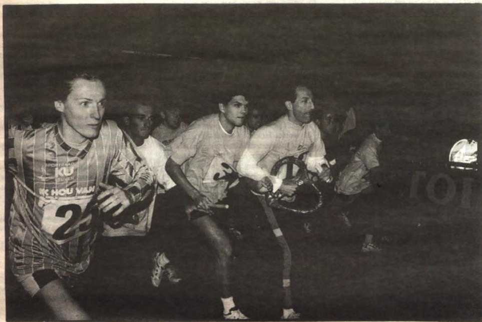
Nog 25.391 rondjes te gaan. De 24-uren: beleaf ze opnieuw, met de zoekertjes op pag. 6 en 7

afgite : Leuven X (weekblad - verschijnt niet van juni tot augustus)