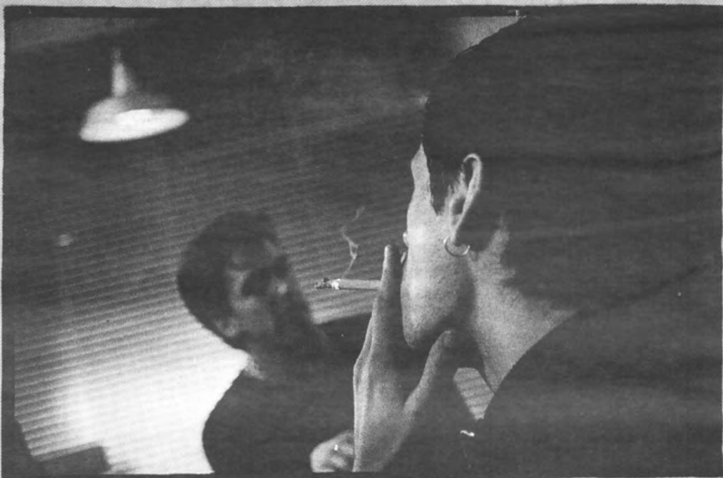
Smoke gets in your eyes