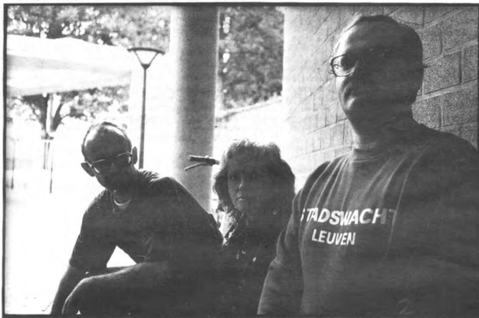
De stadswacht in het donker