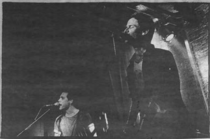
Wie is er vanavond Bob?

McCloud: «In het begin van die song heb ik het over mijn filosofie: 'You've got to be your own dog'. Wees je eigen hond, en zeik waar je dat zelf wil. Ga niet gezichtsloos op in de massa. En als je dan toch een hond moet zijn, wees dan je eigen hond!»