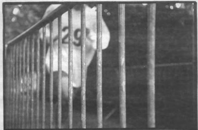
Het zal mij worst wezen wie wint