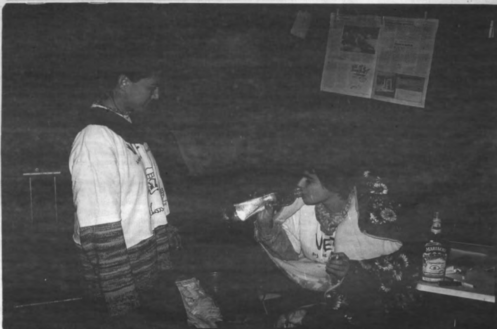
En toen was er... spuitwater

Wie meer over dit initiatief wil te weten komen, kan op 23 november deelnemen aan de activiteitendag (van 14.00 u tot 20.00 u) in het Jeugd-huis 'den Tybe' aan de Vaartkom.