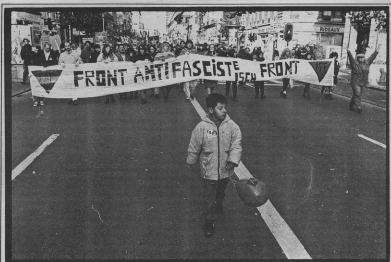
Niet alleen de Leuvense Overkoepelende Kringorganisatie had besloten om niet deel te nemen aan de laatste Jongerenmars voor meer werk en tegen racisme en fascisme, vorige zondag was de algemene opkomst van studenten in Brussel sowieso biezonder laag. Blijkbaar is de bekommernis voor racisme en werkloosheid bij de meeste studenten niet groot genoeg om ervoor op straat te komen.

Voor de Laurel-en-Hardyfilms deed producent Roach hoofdzakelijk een