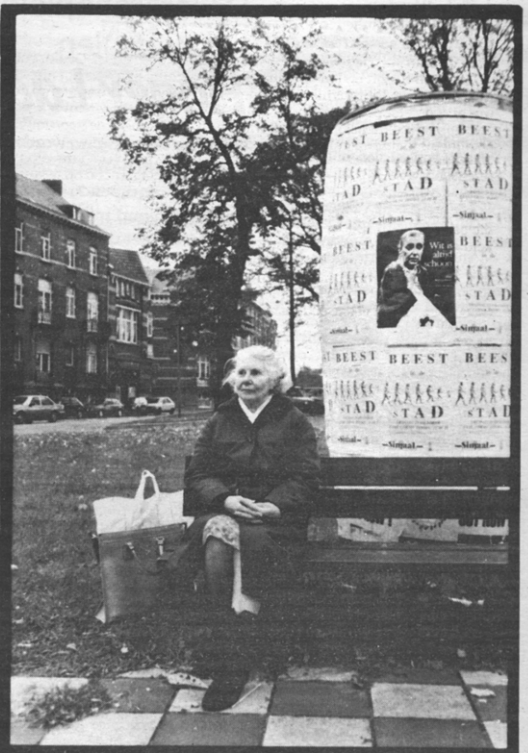
Wit is altijd schoon.