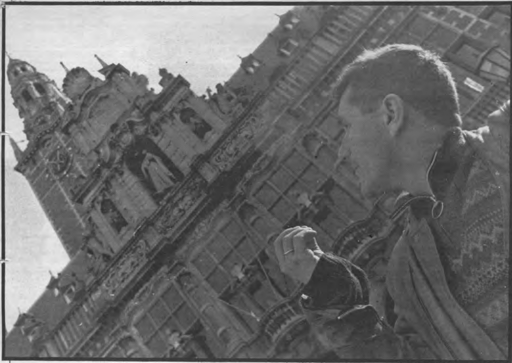
"Postmodernisme is dikke shit: kritiek en cynisme zonder een alternatief te bieden, dat is niet aan mij besteed."

Punkdichter, pitbullterriër der Vlaamse letteren, oligofreen. Didi de Paris! krijgt al even veel adjektieven naar het hoofd geslingerd als hij er zelf maar al te graag uitdeelt. Nu is hij ook nog hoofdredakteur van een nieuw viermaandelijks kultureel magazine: Brain Drain.