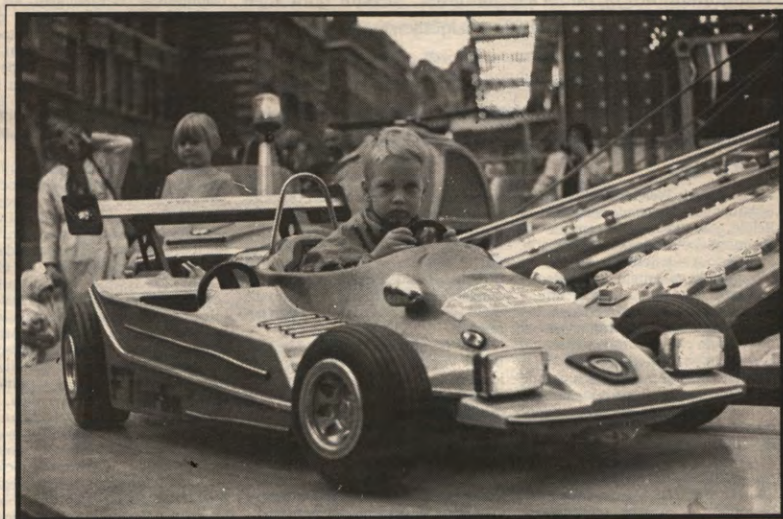
Kindergeld: een van de kollektieve voorzieningen. Lees verder op pagina 2.

Bovendien blijkt uit enkele minder aangename ervaringen van Sociale Raad met haar medebeheer in de laatste maanden, nog maar eens wel een lege doos die studenteninspraak