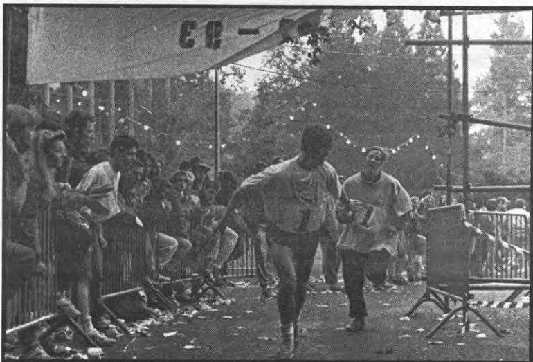
Apolloon wist reeds dat het nummer 1 ging worden