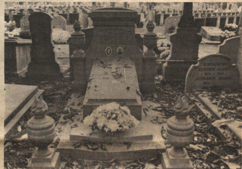
ALLERZIELEN - Sterven is een ernstige aangelegenheid. Sommigen kunnen er zelfs van leven. Wanneer en hoe je doodgaat, kan je niet kiezen, maar wat er daarna gebeurt wél. Veto belicht regelmatig niet-studentieke aspecten van Leuven en wat kan dat met allerheiligen beter zijn dan het beroep van begrafenisondernemer?