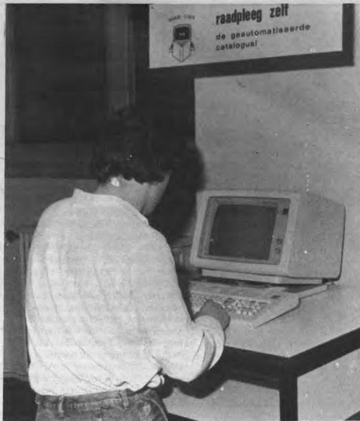
"Wat vroeg u? Libis? Nee, dat woord zit er niet in."

De Koninklijke Bibliotheek is er één van, en niet één van de minste. De herrie rond de Koninklijke Bibliotheek voor de grote vakantie en de onvrede zowel in Wallonië als in Vlaanderen omtrent het functioneren van deze nationale instelling wijst erop hoe de meesten, wetenschapslui en anderen, het niet meer nemen dat de Koninklijke Bibliotheek haar predikaat zo letterlijk neemt en zowel tegenover de