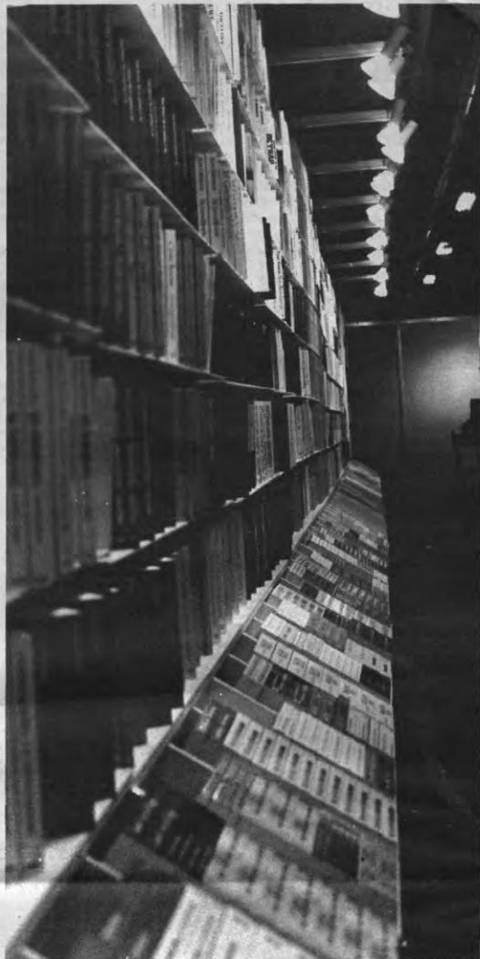
KLEPTOMANE BIBLIOFIELEN krijgen het vast en zeker moeilijk bij het zien van al dit fraais. Ook de boekenbeurs wordt namelijk geplaagd door lui met te lange vingers. Hoe ze dat daar oplossen? Wel, elke standhouder kijkt flink uit zijn doppen of de kijklusters met niets aan de haal gaan. Maar er zijn ook voltijdse dievenspeurders die kontinu tussen de stands kuieren. Diskreet wijzen ze er de "vergeetachtigen" op dat ze nog een boek moeten betalen. U bent gewaarschuwd.

De controle op het uitleengedrag van profen en assistenten is zo goed als onmogelijk daar ze steeds in en uit kunnen fladderen. Het hoeft dan ook niet te verwonderen dat vele boeken zoek raken doo- vergeetelheid of slordigheid. Het zou echter verkeerd zijn hen allen over dezelfde kam te scheren, en ook niet alle bibliotheken hebben last van dit fenomeen. In Theologie bijvoorbeeld zijn er binnenin de bib studiecellen voor doktoraatsstudenten en werkkamers voor profs voorzien.