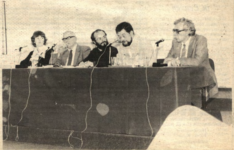
Het panel dat "diskussieerde" over de bevrijdingsteologie.

het dan een sterk veranderde, aansluitend bij eigen bloed en bodem van de Latijns-Amerikanen. Wanneer theologie een nadenken over het geloof is, dan is bevrijdingsteologie een nadenken over de bevrijdende kracht van het geloof. Dit getuigt van een heel nieuwe mentaliteit waarin men de problemen van alledag ernstig neemt. De oude theologie zei dat je je ogen moet sluiten, dat je niet aan de wereld moet denken. De nadruk werd enkel op de zuiverheid van de ziel gelegd. De bevrijdingsteologie zegt daarentegen dat inwendigheid niet genoeg is, dat je je moet inzetten op sociaal vlak omdat daar de massa lijdt. De bevrijdingsteologie gaat de strijd aan met de sociale zonde in de wereld (namelijk ondervoeding, kindersterfte, enz.). Om te strijden tegen die zonde moet men echter eerst weten welke de oorzaak is: oorzaak nummer 1 is de economische afhankelijkheid van de eerste wereld. De strijd tegen het sociale onrecht vindt haar kracht in een gezonde levenshouding; met blijheid komt men op voor anderen. Er is een spontane solidariteit, men vormt een groep. Verder strijdt men hiertegen door het verkopen van produkten in eigen beheer (kwestie van de daden bij het woord (van God) te voegen).