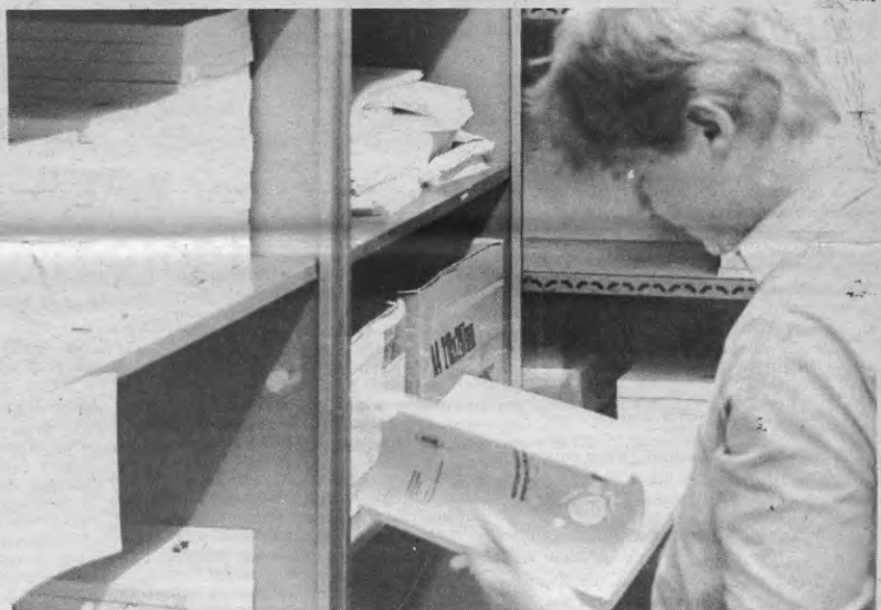
De cursusdienst van VTK: men weet met het papier bijna geen blijf.

De enquête is vorige week gestart en het zal dus nog wel enkele weken duren voor er resultaten uit de bus komen. Het VTK is in elk geval niet van plan deze resultaten dode letter te laten worden. Wat we noteren.