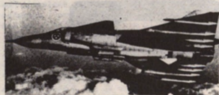
AJ-37 Viggen (Saab-Scania) Bij de 280 miljoen frank per stuk.