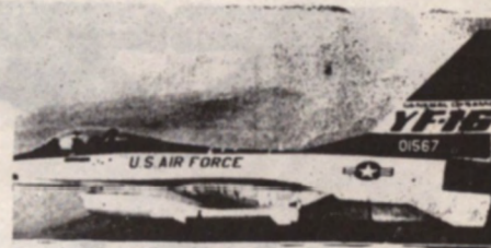
YF-16 (General Dynamics) Iets meer dan 200 miljoen per stuk.