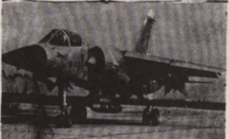
Mirage F1-M53 (Dassault-Bréguet) 220 miljoen frank per stuk, bij aankoop van tenminste 500 vliegtuigen.

is in de rest van de industrie. - DS 4 Juli '74: "aan militaire research wordt jaarlijks gemiddeld 20 miljard dollar besteed." Bewapening betekent inflatie en levensduurte. De oorlogsindustrie wordt bepaald door overheidsuitgaven en dat impliceert hogere belastingen. Bewapening wordt dus betaald