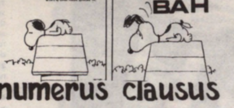
Standpunt van de kringraad over NUMERUS CLAUSUS

Dit bijdrage vanwege de Raad was o.i. verantwoord als een subsidie aan een "socio-kulturele activiteit" van de studenten. Dit is wettelijk iets waarvoor de Raad subsidies mag geven. Daarbij komt nog het niet geringe sociaal belang van die aksie. Na lang gepalaver werd toen beslist dat de ASR op basis van een onkostennota op de raad van 20 december bijkomende subsidie voor 1974 zou kunnen vragen. Op 20 december hebben we dan die (nog onvolledige) onkostennota binnengeleverd ten bedrage van 57.525 fr. (dit behelst allen het deficit van de aksie).