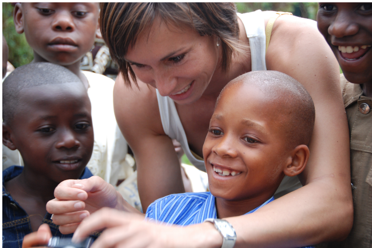
Kim Gevaert aan het werk voor SOS Kinderdorpen

Maar atletiek is niet altijd een evidente sport. Het is niet omdat je veel talent hebt, dat je er ook gaat geraken. Je lichaam moet die trainingen aankunnen. Je moet ook een beetje geluk hebben. Alles moet meezitten. Er is veel potentieel. Ik zie er zeker een paar die voor medailles zullen kunnen gaan op de grote kampioenschappen.»