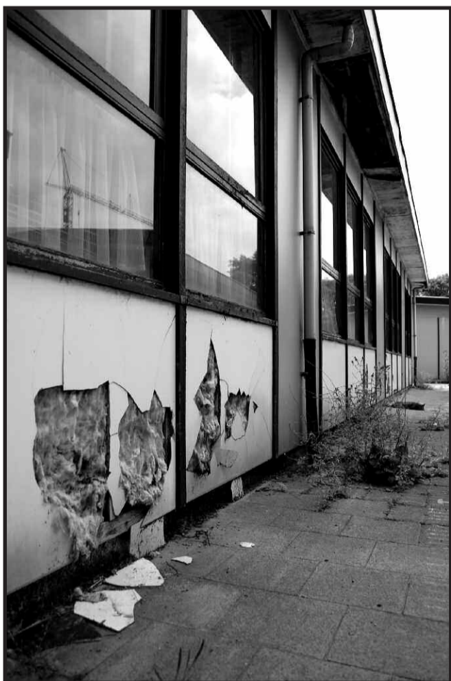
Stedelijk verval