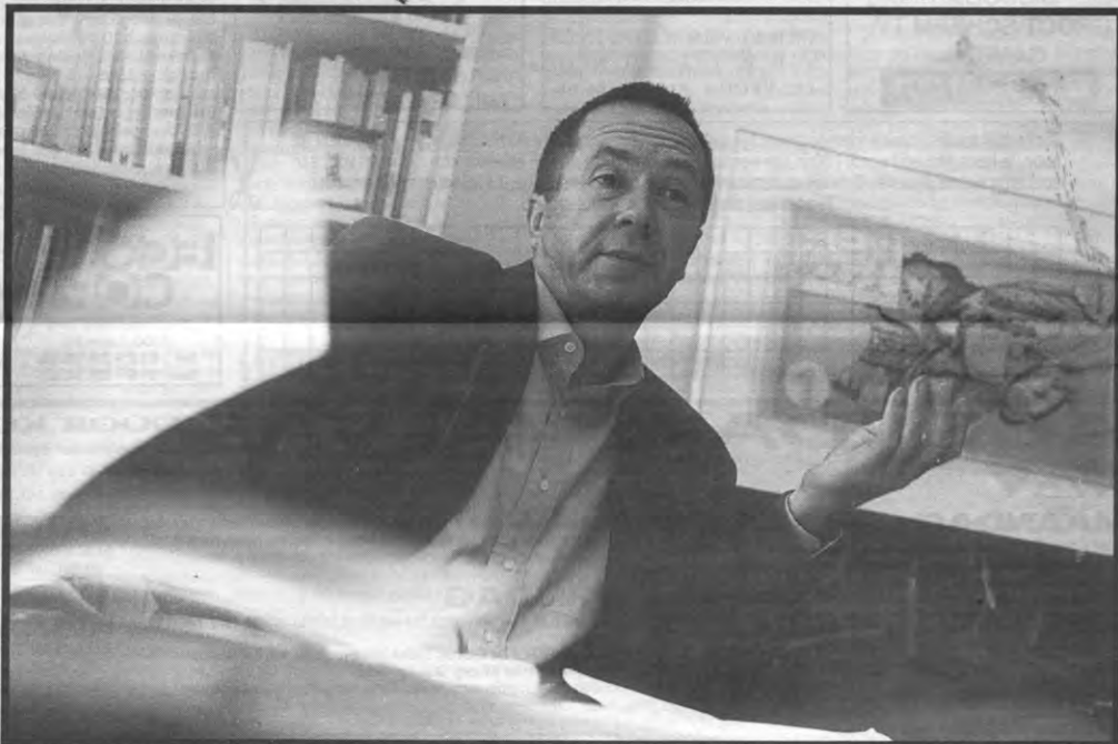
"De universiteit sluit zich heel vaak aan bij de belangen van de betere klasse"

Veto: Is dat dan omdat er geen ruimte voor is of omdat er te weinig individuen zijn die de stap zetten