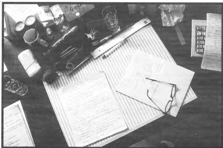
De voordelen van een semestersysteem