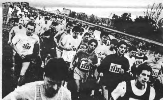
Het is een wedstrijd die je niet winnen kan (naar Bram Vermeulen)