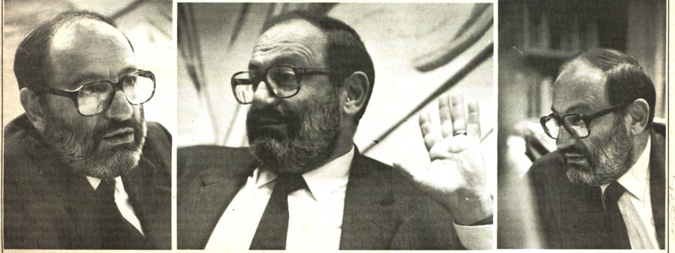
U moet al een kluns zijn om het niet gemerkt te hebben: dé Umberto Eco was in Leuven. Wij betwifelen of de man veel plezier heeft beleefd aan zijn bezoek: konstant van hot naar haar gesleurd worden, iedere avond verplichte etenjes, het een al kopieuzer dan het andere, steeds vriendelijk zijn tegen iedere journalist van BRT VTM of nóg erger... Gelukkig was er Veto. Evenals in 1985 - Eco was toen in Leuven om zijn eredoktoraat in ontvangst te nemen - vindt u het enige en dus eksklusieve vraaggesprek met Umberto in uw eigen lijfblad. Op pagina drie.

STUDENTENWEEKBLAD VAN DE LEUVENSE OVERKOEPELENDE KRINGORGANISATIE - JAARGANG 18, 1991-1992, NUMMER 5, MAANDAG 27 OKTOBER 1991