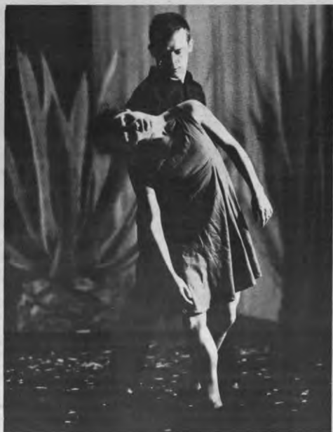
Het was lang geleden, maar eindelijk was er échte dans op het Klapstuk met het Katalaanse Mudances. Hopelijk zat Jan Fabre in de zaal, kwestie van wat goede smaak mee te pikken.