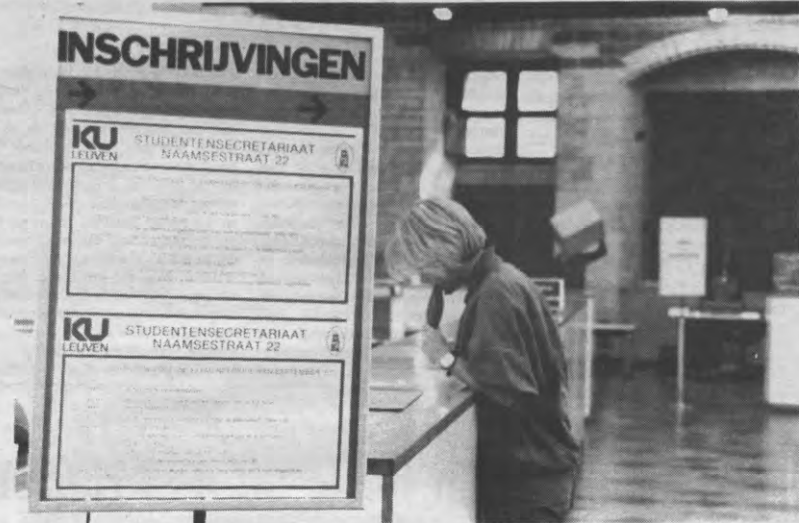
Waar deponereet de KUL haar Inschrijvingsgelden? In een vat van Danaïden!

- bijzondere onderzoeksprogramma's: hiervoor krijgt de universiteit gelden van internationale instellingen, gedecentraliseerde overheden (provincies, ...), allerlei fondsen voor wetenschappelijk onderzoek, de privé-sektor, enzovoorts. Uiteraard verlenen de opgesomde organen enkel geld voor onderzoek. Het geld mag dus niet voor iets anders worden gebruikt, het heeft een welbepaalde bestemming/afheffing. - de sociale sektor: deze sektor krijgt sociale toelagen van het ministerie van onderwijs, beschikt over haar eigen opbrengsten, gelden uit publieke tegemoetkomingen, enzovoorts. Dat geld kan de universiteit enkel en alleen besteden aan de sociale voorzieningen voor studenten, waartoe het initiatief genomen werd in de wet van '60.