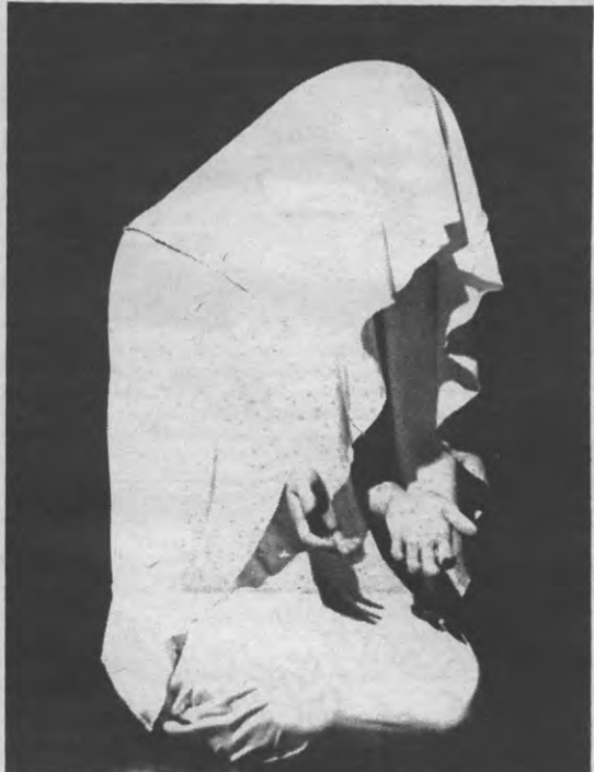
Nadir: een choreografie over 'roerloosheid'. Let vooral op de handen, van het overige ziet men trouwens toch niets.