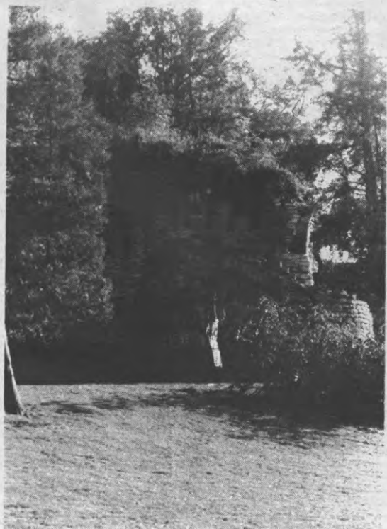
Lichtjes geaffekteerd, dit patrimonium, zouden wij zou met het blote oog van hieruit zeggen. Afschrijven, die boel!