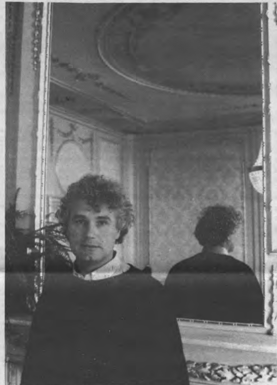
Van Dis: een standbeeld van een vent die flinterdunne boekjes schrijft. Voorwaar een flinke kluit voor Freud.

Veto: De mannelijke kant van uzelf etaleren ligt u veel minder. Als u daarvoor begint, schrijft u op karikaturale wijze.