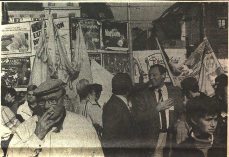
VREDESBETOGING - Gisteren betoogden zo'n 150.000 aktievoerders voor nukleaire ontwapening. In feite was het een makke optocht in een zonnig Brussel. Er waren enorm veel jongerenorganisaties aanwezig; maar natuurlijk ontbraken ook onze nationale politici niet. Als vanzelfsprekend stuurden SP VU en Agalev samen met 'klein links' een sterke delegatie. Opvallende aanwezigen waren het ACW en de CVP-jongeren. Beide organisaties waren er in '85, toen de raketten in Florennes werden geïnstalleerd, niet bij. Eens zien of deze laatste bij de komende verkiezingen op 13 december voet bij stuk zullen houden.

Vaka is groot geworden met de raketten, het is ook slechts een aktie-komitee , en moet dat gebrek aan achtergrond, aan een dieper, algemener gevoel van be-