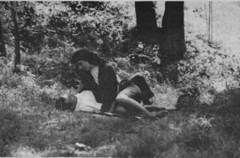
politie pakt zes getuigen op om de moordenaar te zoeken, wat kruimeldieven, een souteneur, een jonge werkloze en een lusteloze soldaat. Op wrange wijze wordt de leefsituatie van dit onfrisse gezelschap ontleed.