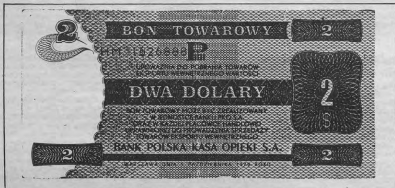
De Poolse dollar: een bon die in de Pewex-shops als volwaardig betaalmiddel geldt. Verder is zij niets waard, behalve om handel te drijven op de zwarte markt.

Beckett als choreograaf? Zijn perso- nages zijn taalsysteem ingebouwd in lichamen die geen verwijzing naar een mogelijke alledaagse doe-reëliteit van de personages inhouden. Hun licha- melijkheid is eerder een geperverteerde en gehinderde lichamelijkeheid: Beckett's universum wordt bevolkt door blinden, lammen, door persona- ges die leven in vuilnisbakken, vast- gebonden of half ingegraven zijn. Hun bewegingen hebben op het moment dat ze plaatsvinden geen onmiddellijke oorzaak of doel en worden gevolgd door de tegenovergestelde, als om hen te niet te doen. Lichamelijkeheid en beweging worden aldus geïsoleerd en vele klonneske effecten vinden daarin hun oorsprong. Op sommige ogenblikken lijkt het