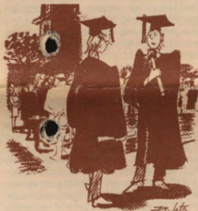
Ik weet nog niet wat ik ga doen: sociale vorming geven of geschiedenis, of doppen...