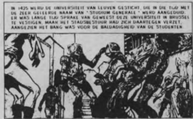
uit de strip: "Brussel, 1000 jaar roemrijke geschiedenis" J-L Vernal & Frans

Bij ons zou het echter ook goed kunnen zijn dat sinds menscheugenis ook de sociale sektor van de KULeuven een deficitbegroting in moet dienen. Dat zit er zeker in.