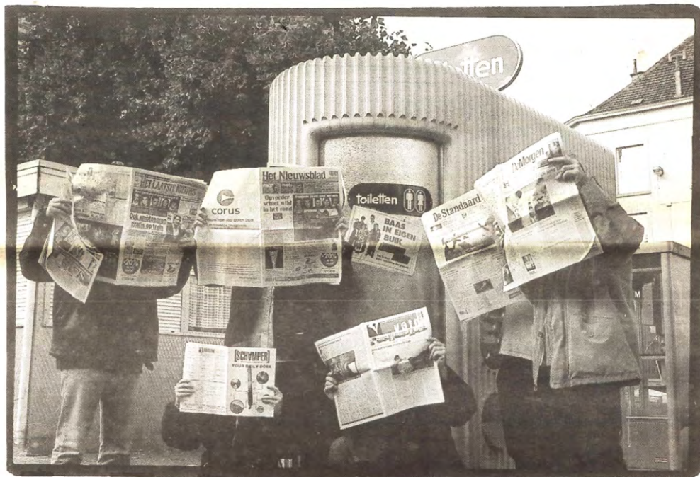
Hoe moet de pers reageren op ekstrem-rechts? Moeten de kranten een cordon sanitaire ophouden? En de TV? En hoe zit het met de korrektionalisering van racistische permissiedrijven? Veto zoekt naar antwoorden in het Middelpunt op pagina's 8 en 9.

Het artikel 406 werd ook al in 1993 gebruikt om manifestanten te vervolgen die