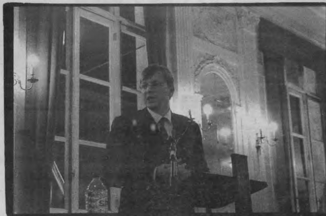
Veto was erbij op het debat. Premier Verhofstadt ook.

Afrikanen naar Gibraltar en elke dag kan je er de aangespoelde lijken zien van degenen die het niet gehaald hebben. De overtocht, die elk jaar duizend doden eist, wordt 'verzorgd' door nietsontziende mensensmokkelaars. Aan de overkant van de Middellandse