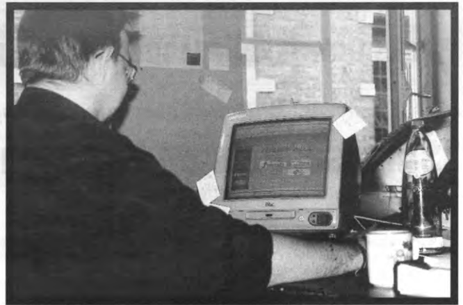
Daar zit muziek in

Het veralgemeende gebruik van loginnamen zorgt er bovendien voor dat de universiteit gemakkelijker statistische gegevens kan verzamelen over het effectieve gebruik van KotNet. Ze is zo ook iets beter gewa-