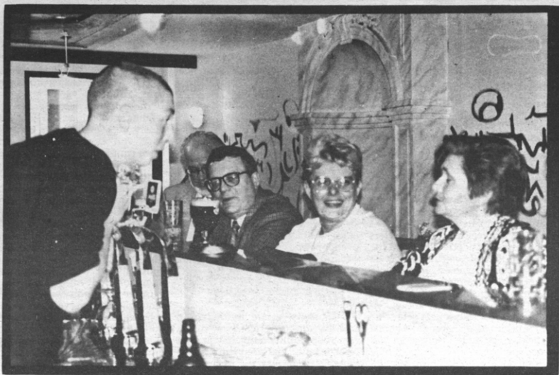
Het schepenkollege vergadert vanaf nu in de Clockwork.

Vzw jeugdhuis Clockwork gaat er prat op dat zij een van de enige kafees in België zijn die de wereldbepaalde Chinese noedelsoep serveren.