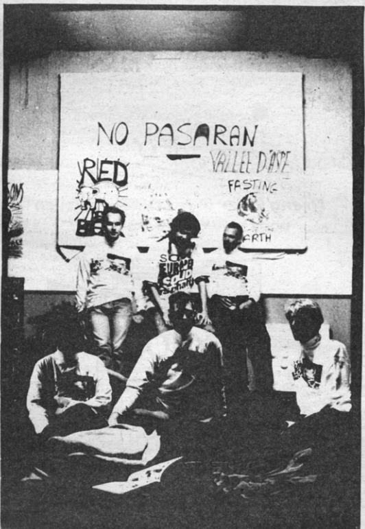
De déjeuner sur l'herbe