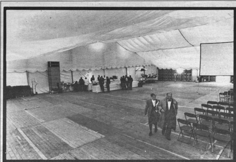
De Alumnidag vorige zaterdag bleek toch niet het verhoopte succes te zijn dat de organisatoren verwacht hadden. Zelfs wij hebben ons in de luren laten leggen en hebben er vorige week een heel artikel aan gewijd. Niet getreurd evenwel, want iedereen leert uit zijn fouten.

Uitgangspunt van het essay is Zorns stelling dat, in tegenstelling tot de klassieke opvatting, de twintigste-eeuwse kunstwerken niet langer meer