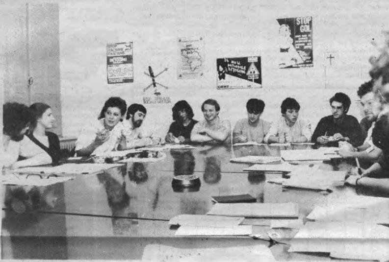
Sociale Raad vergadert

sektor mee te beheren. Dat zijn beweging weinig visie of werking rond diezelfde sociale sektor heeft, is blijkbaar van geen tel. Niet alleen de studenten- maar ook de personeelsdelegatie ontkende dat enkel representatief een norm is voor het eisen van mandaten. Uiteindelijk werd door de RvS aangedrongen om een gezamenlijke vergadering van Sociale Raad en Krul te beleggen, waarop alle kringen samen de vijf mandaten zouden toewijzen. In de loop van vorige week werden alle fakulteitskringen dan ook aangeschreven. In Veto verscheen een vakature voor vijf effectieve en twee plaatsvervangende vertegenwoordigers van de RvS. Elke student die zich wilde inzetten voor de verdediging en de uitbouw van de sociale sektor kreeg