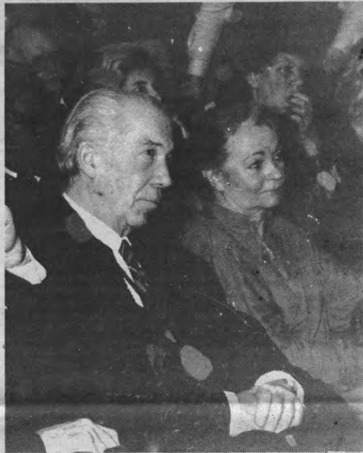
Professor De Duve bij zijn eredoctoraat in '84