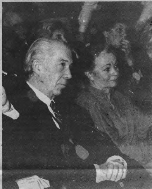
Professor De Duve bij zijn eredoctoraat in '84