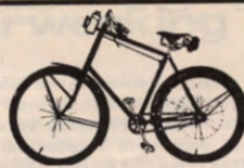
THE VC BIKE VERSUS THE USAF PHANTOM

De prestigeuniversiteit kan op een aanwinst bogen, de universiteit als onderwijsinstelling is er niet mee gediend !