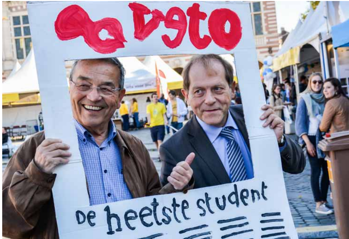
Woensdag ging Veto tijdens de Studentenwelkom op zoek naar de heetste student. Op een of andere manier sukkelde deze heren het beeld in.