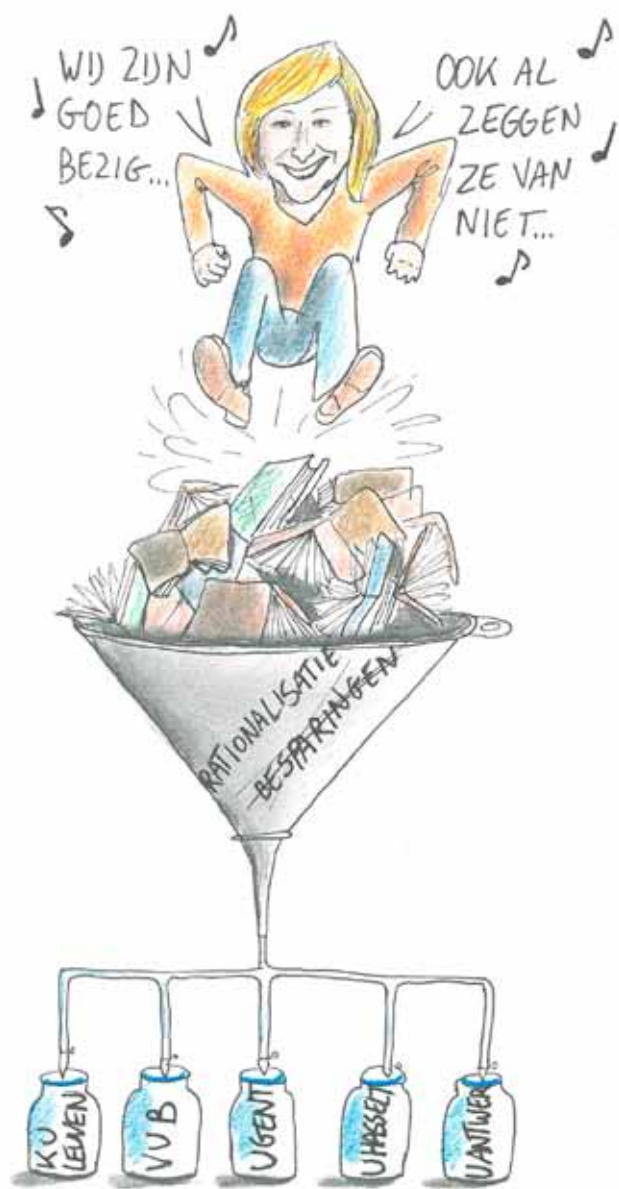
CARTOON Martijn Stoop