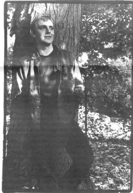
De appel valt niet ver van de boom

«Er worden ook continentale meetings gehouden. Zo was er twee jaar geleden de Afrikaanse meeting in Togo. Wij, de Euro-