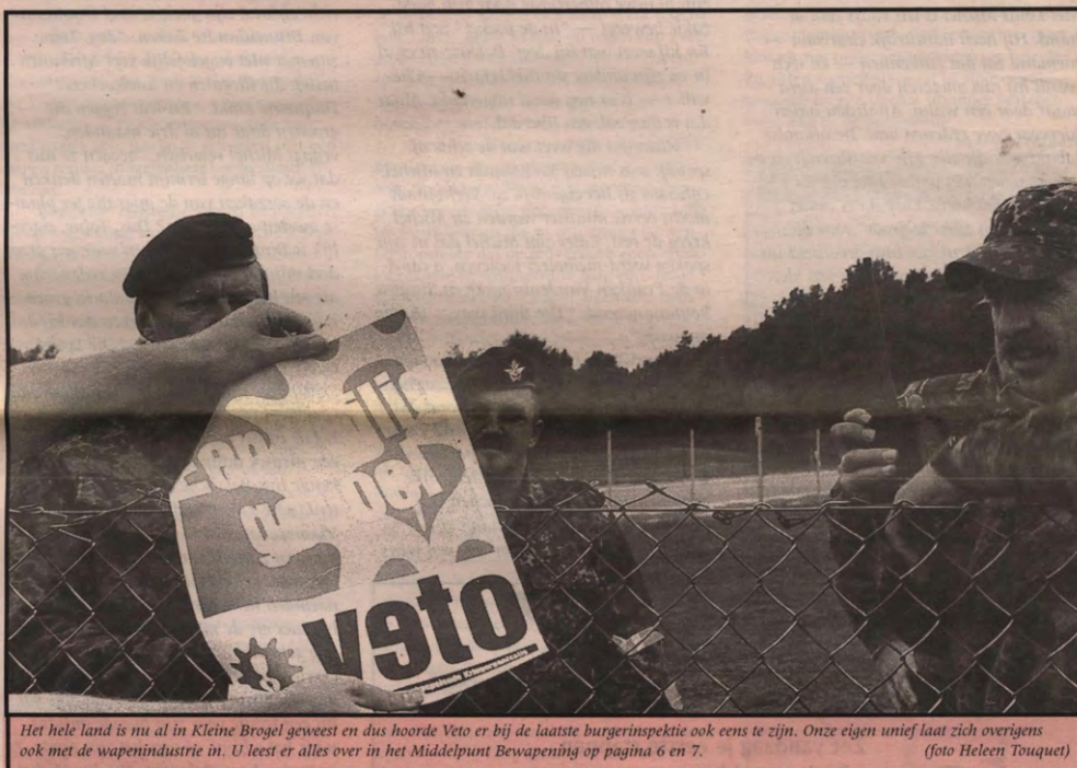
Het hele land is nu al in Kleine Brogel geweest en dus hoorde Veto er bij de laatste burgerinspektie ook eens te zijn. Onze eigen unief laat zich overigens ook met de wapenindustrie in. U leest er alles over in het Middelpunt Bewapening op pagina 6 en 7.

gaan, moeten eerst de onderhandelingen met de vakbonden rond zijn. Om de fusie mogelijk te maken dient het personeelstatuut van Alma en dat van de Faculty Club op één lijn gebracht te worden. Een dergelijke fusie wordt beschouwd als een "overdracht van onderneming" en wordt door de wetgever geregeld met de Collectieve Arbeidsovereenkomst 32 bis. Deze cao bepaalt dat bij zo'n overdracht het personeelstatuut — loon, vakantieregeling, premies, enzovoort — van de ene onderneming ongewijzigd overgaat naar de andere. Over de werkgelegenheid wordt niet onderhandeld. Beide werkgevers — KU Leuven en Alma — wensen de huidige, individuele tewerkstelling te garanderen. Op termijn zou de nieuwe structuur zelfs voor bijkomende arbeidsplaatsen moeten zorgen.