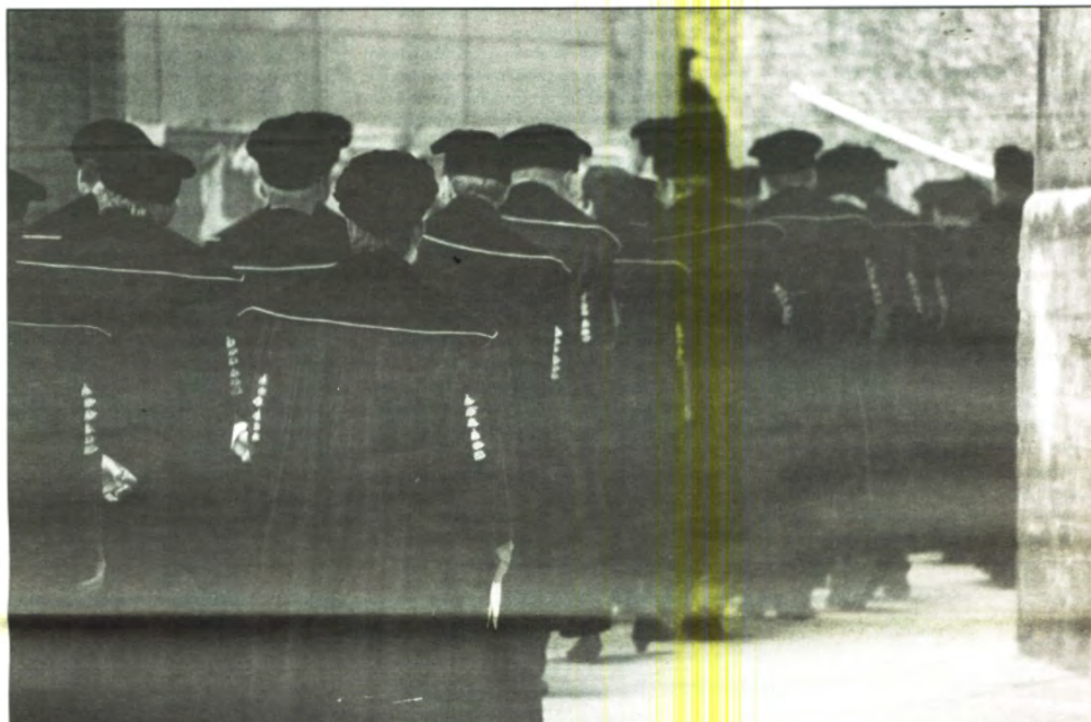
Rektorenclinch: Dat de academische wereld niet altijd braafjes in het gelid blijft lopen, werd de afgelopen week wel duidelijk. Veto maakt de roundup van het rektorale gebakkelei rond het rapport-Dillemans op p.3.

Inmiddels blijkt dat her en der testen worden uitgevoerd met het oog op de ontwikkeling van een algemene oriëntatie-