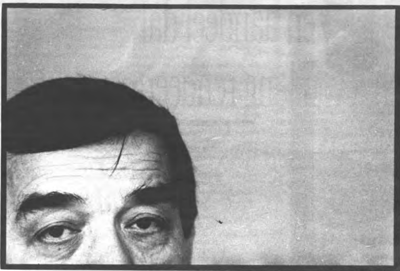
"Er komen ongeveer veertien agenten bij."

Minister Tobback voorstellen hoeft niet meer. De man van het gezond verstand doet met de gemeenteraadsverkiezingen een gooi naar de titel van burgemeester van Leuven. Hij wil naar eigen zeggen vooral werk maken van een degelijk woningbeleid en tewerkstelling. Bovendien wil hij het contact met de bevolking herstellen door de invoering van gemeentelijke referenda.