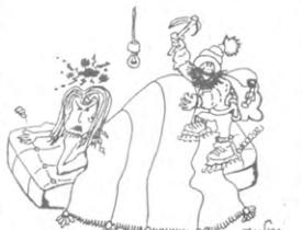
Met 6 maanden houwtijd bleek dies passie voor natuur-sporten eens bijzeker te zijn.

Op woensdag vijf oktober kunnen alle geïnteresseerden vanaf 14.00 u terecht in het Universitair Sportcentrum aan de Tervuursevest voor informatie over en initiatie in de verschillende sporten.