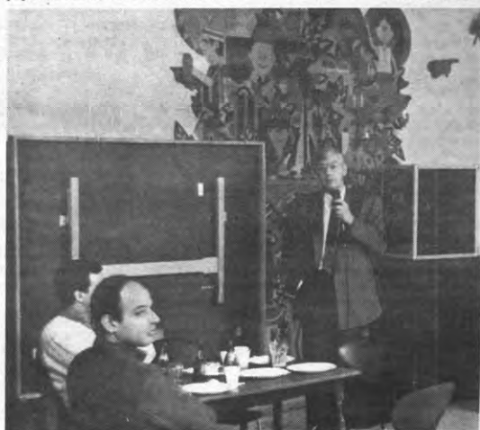
In de bar van Isol is al menig Japans pingpong talent geboren.

Eindredaktie: Walter Pauli, Stef Wauters Zetwerk en publiciteit Alfaset Leuven (016/22.04.66) Drukkerij Rotapyl Brussel Oplage 9000 eksemplaren ISSN-nummer 0773-5162 Abonnementen Studenten: 250 fr.; niet-studenten: 300 fr.; steun vanaf 600 fr.; over te schrijven op rek. nr. 001-0959719-77 Agenda en Ad Valvas ten laatste vrijdag voor verschijnen om 18.00 uur op het redaktieadres bezorgen Redaktievergadering iedere vrijdagmiddag om 15.00 u