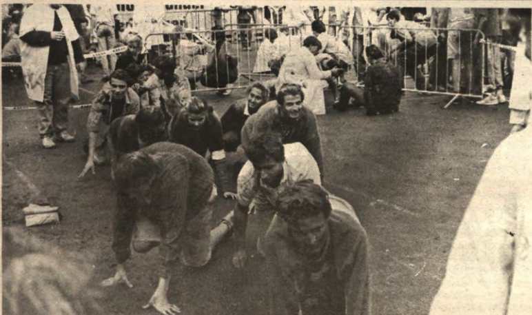
Dergelijke laag-bij-de-grondse spektakels zullen de deftige Leuvense student in het vervolg bespaard blijven. Met dank aan het stadsbestuur.

STUDENTENWEEKBLAD VAN DE LEUVENSE OVERKOEPELENDE KRINGORGANISATIE - JAARGANG 18, 1991-1992, NUMMER 3, MAANDAG 14 OKTOBER 1991