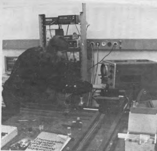
Wetenschap: een kwestie van het juiste knopje, de juiste bediening en het juiste moment.

Wetenschapswinkel stelt als noodzakelijke voorwaarde dat de aanvragers zelf niet over de nodige financiële middelen beschikken om een onderzoek te laten uitvoeren. Hierdoor kunnen zij hun vraag naar onderzoek niet rechtstreeks aan een universiteit richten, in tegenstelling tot bijvoorbeeld grote industriële ondernemingen en de overheid. De onderzoeksaanvrager mag verder zelf niet over de nodige deskundigheid beschikken om een wetenschappelijk onderzoek uit te voeren.