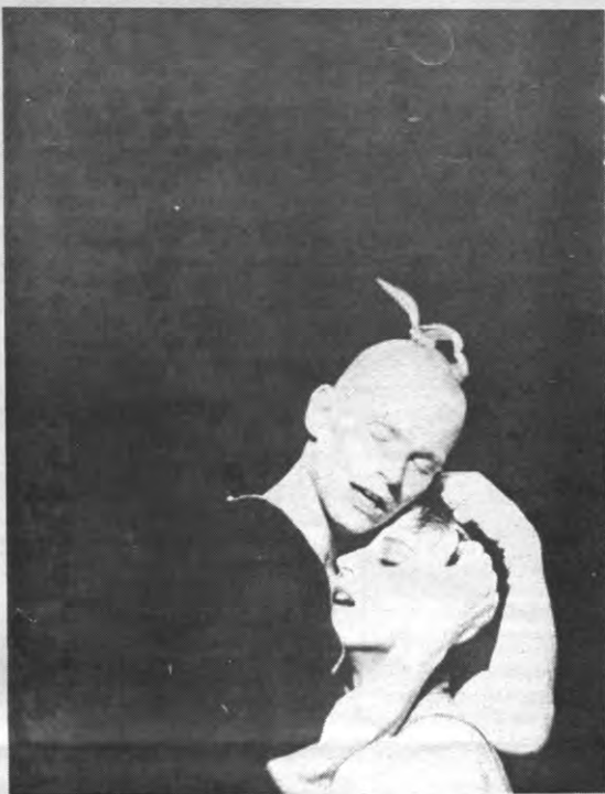
Een niet gepland en niet gesubsidieerd stuk waarin met cijfers en messen wordt geoid.