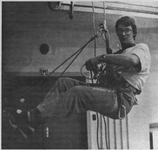
Het kabelkreet op de helling.

De tweede bewegreden van Sportraad: de studenten de weg tonen naar het Sportkot te lokken, maar ook om te tonen dat een student gewoon als ontspanning of in competitieverband aan sport kan doen. Het Leuven Sport-instituut, ook wel Sportkot genaamd,