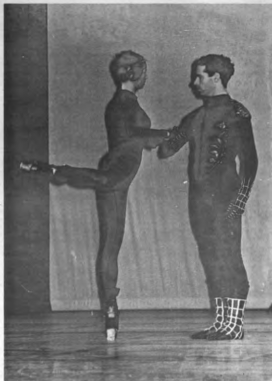
Klapstuk: waar Robin Hood en Batwoman elkaar de hand reiken.