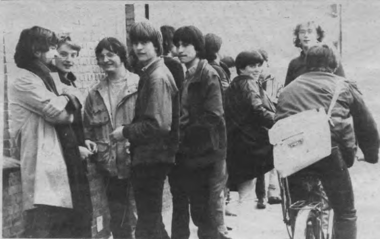
Deze studenten zijn zeer zeker verouderd. Maar zij hadden tenminste nog rechten.