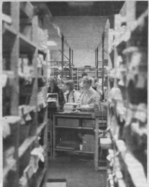
AANSCHUIVEN - Ook u kunt in Acco wel eens een keertje in de rij gaan staan. Voor weinig geld krijgt u dan stapels gedrukte ellende toegestopt.