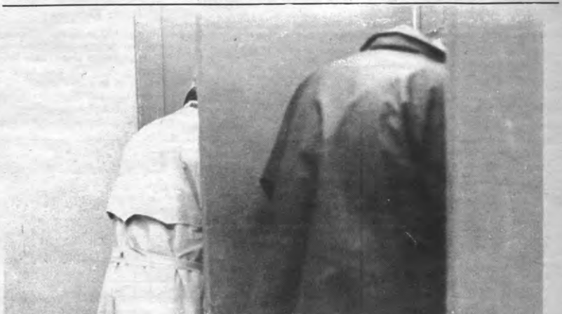
STEMMIG Als u dacht dat dit hier de nieuwste toiletten van het rektorat betrof, dan had u het mis. Of maakt u daar bij u thuis ook bolletjes rood?

Studentenrecht. Sociale en juridische gids voor de student hoger onderwijs. Acco 1988, 380 BF (325 BF voor leden).