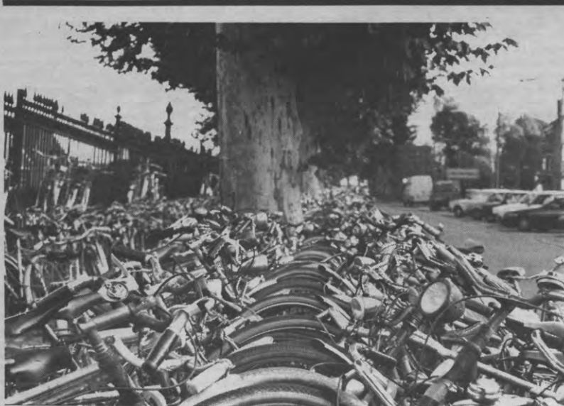
Ik fiets, dus ik ben. Alleen: aan het station van Leuven mag je in theorie maar 1 uur zijn. Eén uur? Inderdaad, en wanneer de politie één uur na de het bevestigen van een verwitting aan je fiets hem nog aantreft, mag hij de koffer in. Dag