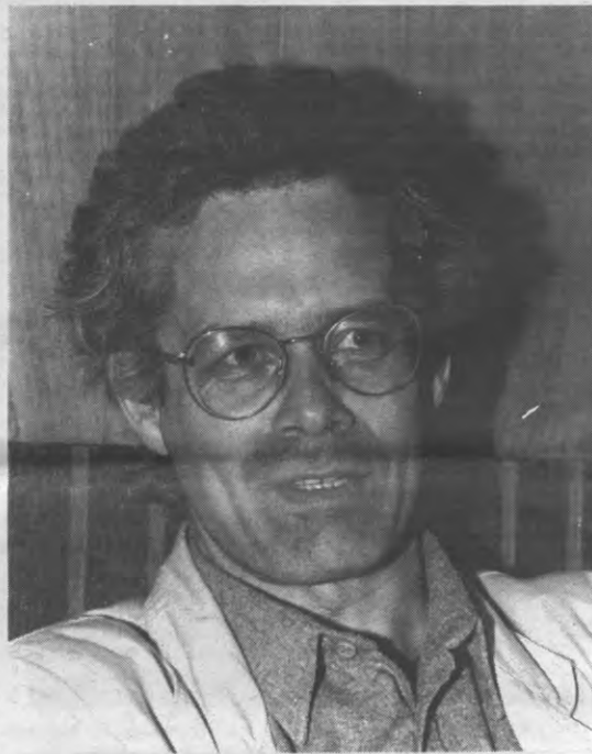
"Al dat gepraat en geschrijf over het einde van de leeskultuur moet enigszins relativerend worden."

ook de grote boekenbeurs begon... Ja, dan begin je je toch af te vragen of deze twee boekenbeursen niet gevaarlijk naar elkaar aan het toegroeien zijn. Actiegroepen en kleine organisaties hebben hier nog wel allemaal een standje, maar toch zie je dat de belangstelling van het publiek hoofdzakelijk naar de standen van de grote uitgeverijen gaat". Reactie van Van Halewyck: "We willen niet concurreren met de grote Antwerpse boekenbeurs. Dat is een monument in het boekvak waaraan we niet willen toeren".