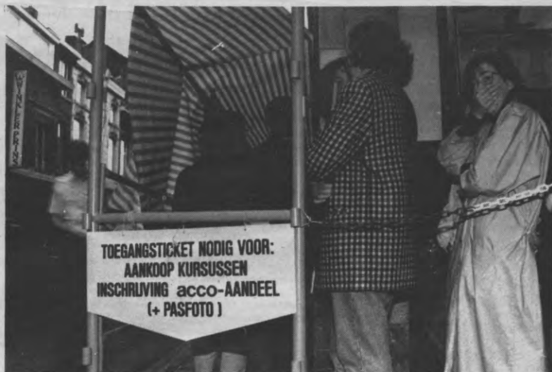
MET EEN ACCO-AANDEEL win je altijd. Ook in de file, nu opgestuurd door de sponsors. Ga dat zien. Maar niet allemaal tegelijk. Toestanden hebben ze daar nu al genoeg.