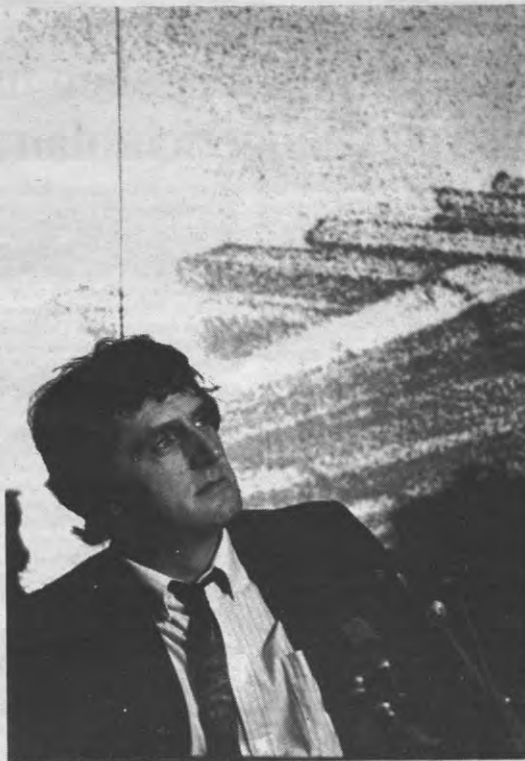
WAT ZIE IK daar? Een interview? Met mij? In de volgende Veto, zeker weten.

Veto: De toekomst nu. U sprak al over een adviesraad. Zijn er al namen?