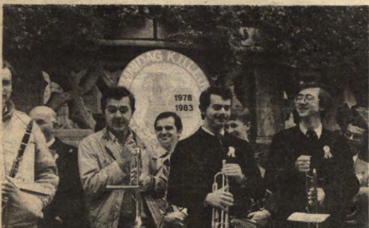
Zaterdag 8 oktober werd de tweede Alumnidag opgeluisterd door o.a. de heren op de foto. Leuven terugzien en sterven? (foto Wim Verhelst).