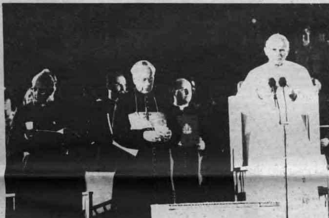
De katholieken zijn ook voor de vrede gewonnen, als de Russen zich koest houden, tenminste...

Onder meer het Algemeen Christelijk Werkersverbond (ACW), Pax Christi, de Kristelijke Werknemers Beweging (KWB), de CVP-jongeren dringen sterk aan op uitstel van deze beslissing, om de onderhandelingen in Genève wat meer tijd te gunnen, zonder evenwel aan deze periode een bepaalde tijdsruimte te verbinden. Het ACW zegt bv. dat deze opschorting aan een redelijke tijdslimiet moet worden gebonden. Het ACW verbindt echter terzelfdertijd een belangrijke voorwaarde aan deze opschorting, nl. de Sovjet-Unie dient zijn geloofwaardigheid te bewijzen door een aanvang te maken met de afbouw van zijn SS-20 raketten.