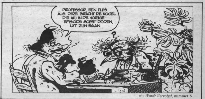
uit Wordt Vervolg , nummer 6

Sokal: Canardo , Pepperland, Brussel, 48 blz. (wellicht onvindbaar). Sokal: Moord in de Berm Het teken van Raspoetin De zachte dood Alle drie bij Casterman uitgegeven, 46 blz./112 frank.