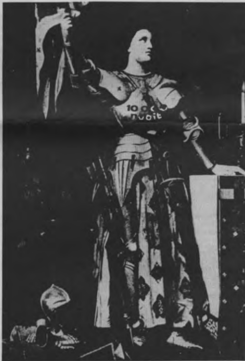
dekt de slogan "10.000 nooit" volledig de lading?

Het antwoord daarop is nee, juist omdat die gemeenschapsgelden niet de laagste socio-economische groepen ten goede zouden komen, wel integendeel. Konform aan deze logica hebben potentiële bondgenoten van de studentenbeweging (de kristelijke arbeidersbeweging bv.) besloten hun inspanningen te richten naar beroeps- en technisch onderwijs, naar de permanente vorming en naar een zinnvolle verlenging van de leerplicht. Geld dat via verhoogde inschrijvingsgeld en de begroting wordt bespaard kan in het beroeps- en technisch onderwijs veel "demokratischer" worden gebruikt omdat daar juist het overgrote deel van de kinderen uit de lagere socio-economische groepen terecht komen. Uiteraard is deze stellingname, op het punt van haar ideologie, voor kritiek vatbaar, maar zoals h.f. in een vorig artikel stelde: "Gratis onderwijs ja, 10.000 nee" alleen is te gemakkelijkt. (6)