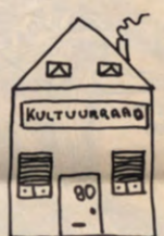
5. Bankstraat X. Kultuurraad