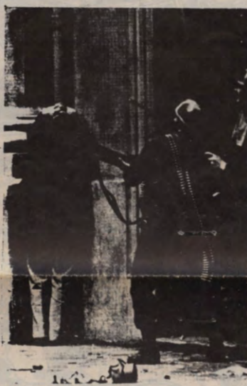
(Chili putsch 1973)