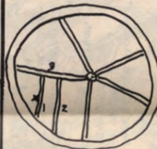
1. Heilige Geeststraat 2. Kapucijnenvoer