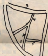
3. Brusselse straat 4. Goudsbloemstraat