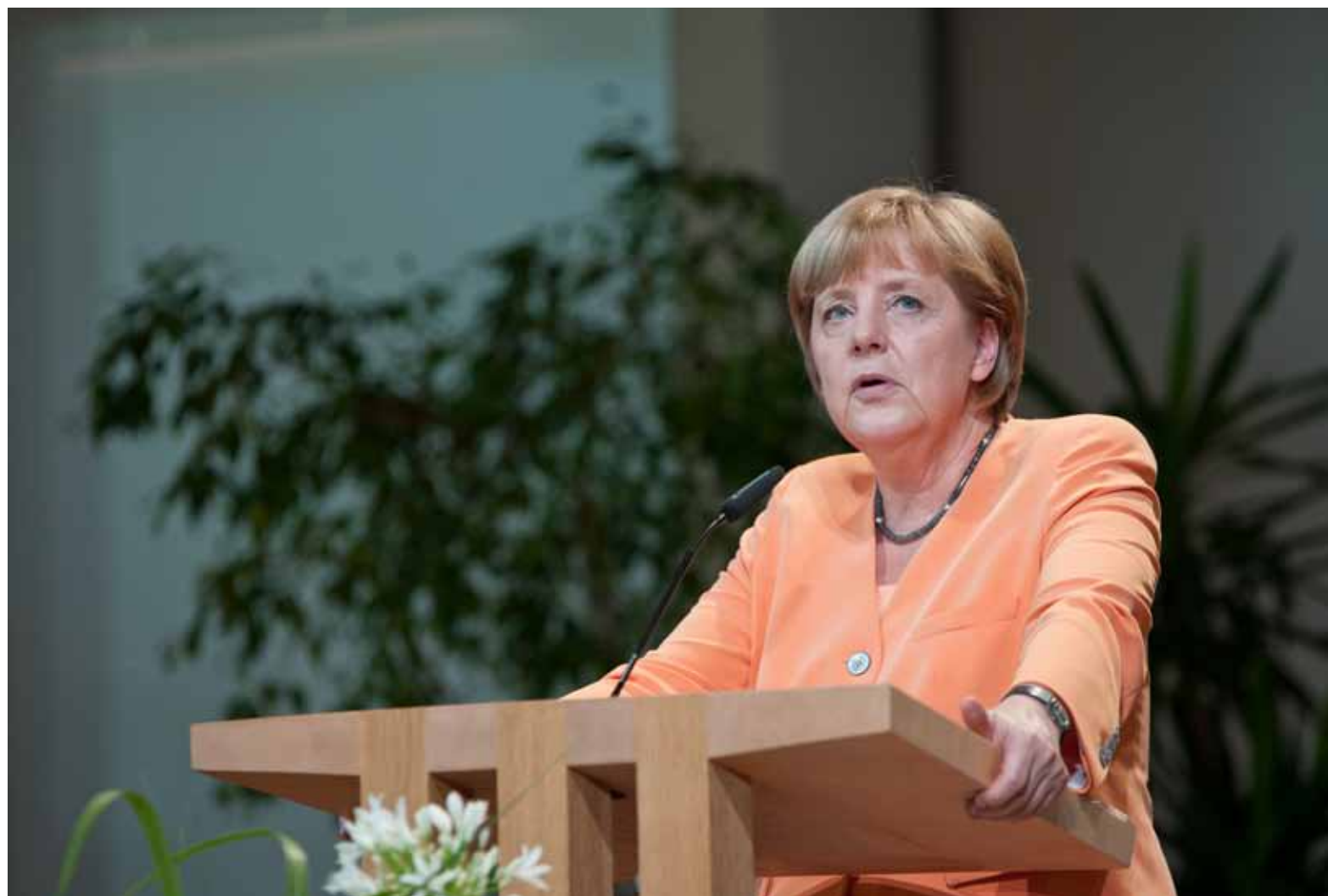
De Duitse bondskanselier Angela Merkel.