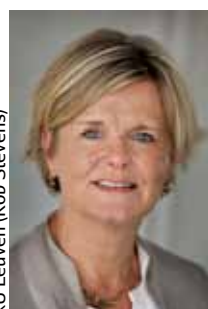
KU Leuven (Rob Stevens)