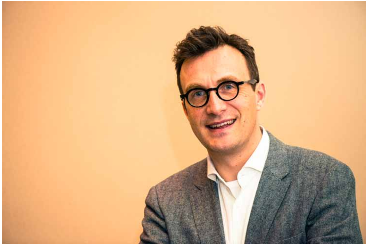
Vlaams minister van Onderwijs Pascal Smet (sp.a) vindt dat studenten meer moeten nadenken. “Ze doen dat minder dan vroeger. Ze mogen meer dingen in vraag stellen. Enfin, ik wil ook niet als een bompa klinken.” Interview op pagina 3