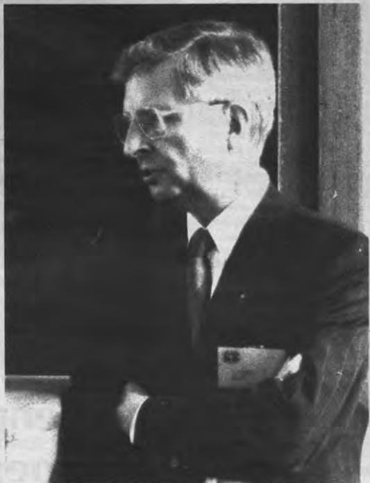
Deze man kijkt ernstig en ontspannen voor zich uit. Het lijdensverhaal van de mensen houdt hij voor een andere keer.

Veto: Dat is dus het dilemma waar de kerk mee te maken krijgt. De vrouw