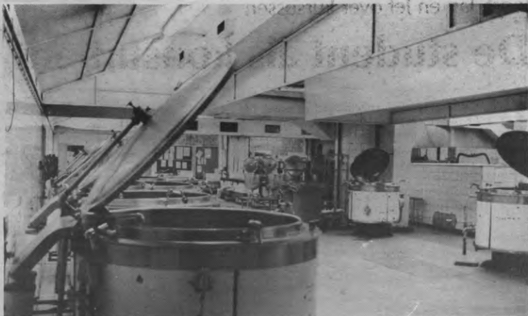
Deze machines wassen uw sla.

Als je aan een willekeurige student vraagt om alle studentenrestaurants op te sommen, dan komen de meesten niet verder dan vier of vijf, en men zal bijna altijd eerst Alma 1, 2 en 3 noemen. De kleinere uitbatingen zijn inderdaad minder gekend bij het grote publiek. Nochtans bieden die goede gelegen uitwijkmo-