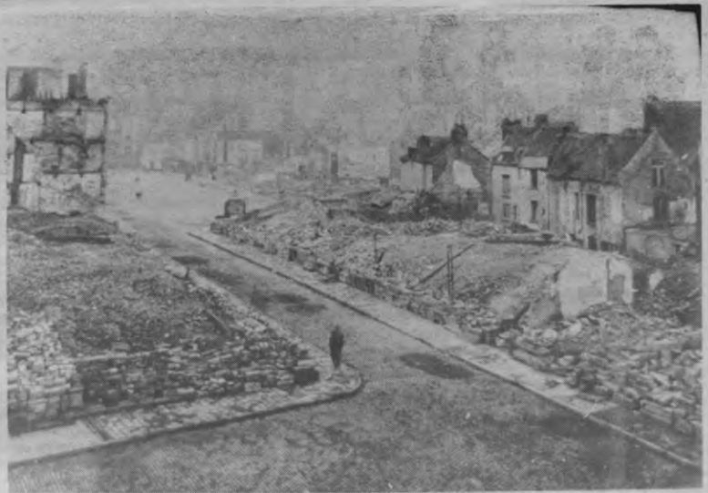
Zo zagen toen de Grote en de Oude Markt er uit.

Leuven brandt nog tot 21 oktober in de Centrale Bibliotheek. Tijdens de week dagelijks van 9 tot 19.00 u, op zaterdag van 9 tot 12.30 u. De toegang is gratis en een verhelderende brochure kost 20 fr.