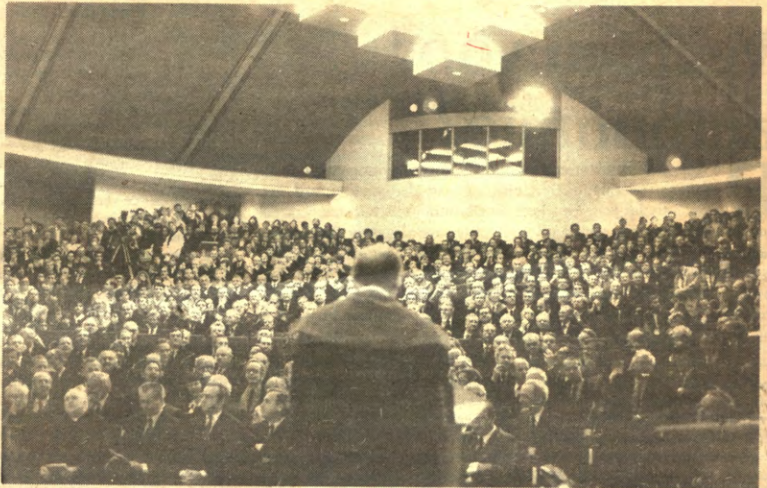
Hoe groter de aula, hoe meer prominenten.