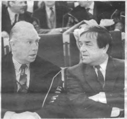
Onze spion zat achter hen. Ze hadden het over Luik.

Allesmaal heel mooi. Hoewel je je kan afvragen of hij de betekenis van het (katholieke) universitaire Europa niet sterk overtroeft als hij stelt dat het Erasmusproject belangrijker is voor Europa dan "vele nachtelijk losgewrongen akkoorden met viktorie-bulletins in de mistige morgen van het economisch Europa." Of wanneer hij beweert dat enkel de Europese uniefs de boodschap dat wetenschap ten dienste moet staan