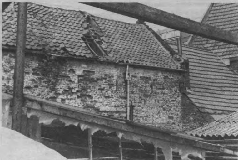
Hier komt op zes december niemand langs.