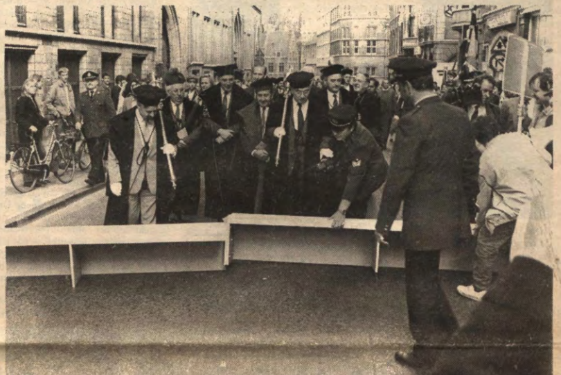
Omdat door de regeringsmaatregelen de drempel van de universiteit heel wat verhoogd is, werd er door het Regionaal Aktie Komitee (RAK) besloten tot (ludieke) aktie. Toen de hoge heren van de kerk terugkeerden vonden ze plots op de Naamsestraat een kleine hindernis: een nogal hoge drempel. De drempel werd door heel wat 'togati' al dan niet bijzonder fluks genomen, tot één van de bejaarde heren het academisch minimum echt niet haalde. Gelukkig is in Leuven de politie nog steeds uw vriend, zodat de drempel snel werd weggehaald. Alleen voor studenten is het iets moeilijker om die drempel te overschrijden.

Een "ontologische" passage sloop de rektors (lange) toespraak af. Een echte universiteit is een huis van hoop. Ze bereidt individuen voor op een