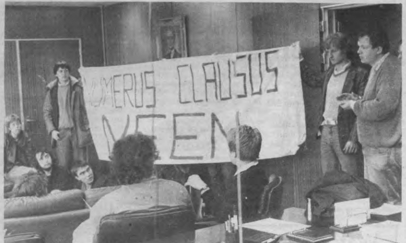
BEZETTING COENS KABINET — Hoe meer de regering zich ontfermde over de heilige Sint-Anna, hoe ongeruster de studenten werden. Ze besloten dan ook wat weerwerk te bieden en richtten in februari een nationaal actiecomité (NAK) op, dat samengesteld is uit vertegenwoordigers van alle Belgische universiteiten. Op het einde van vorig academiejaar werd door het NAK beslist om vanaf september een boycot van de inschrijvingen te organiseren als protest tegen de verhoging van inschrijvingsgeld en de halvering van de sociale toelagen. Om de boycot aan te kondigen en hun ongenoegen ten aanzien van de regeringsmaatregelen te laten blijken, werd op donderdag 28 augustus het kabinet van Coens door een 30-tal afgevaardigden van het NAK bezet. Ze verbleven er ongeveer anderhalf uur en verschaften ondertussen een woordje uitleg aan de pers. Coens was wel niet aanwezig op zijn bureau. Naar verluidt was hij verstrikt geraakt in zijn eigen omzendbrieven. Kort voordien moet hij daar nachts geweest zijn, want het dubbel bed in de kamer naast zijn bureau was niet opgemaakt. Of had Coens tijdens het hazepad gekozen?

Naast deze boycot kreeg de VUB nog met een ander probleem af te rekenen. Begin september wees de Vereniging van Vlaamse Studenten erop dat in het Koninklijk Besluit van 21 augustus uitdrukkelijk staat dat de Raden van Beheer van de verschillende universiteiten een beslissing omtrent de verhoging van de inschrijvingen moeten nemen vóór 1 september. Aan de VUB,